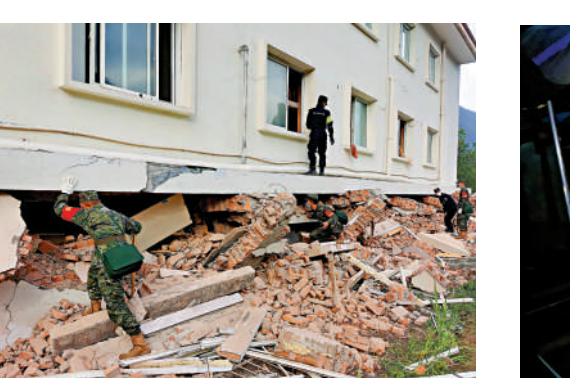
▲武警四川總隊甘孜支隊官兵在瀘定縣搜救被困群眾。

記者從前往震中的媒體朋友處獲悉，在趕赴磨西鎮的過程中，雅康高速、雅葉高速等通行正常，並已進行管控，以保障救援車輛的通行。但行駛到國道、省道上後，有的山體坍塌，滾落的石頭堵住路面。多支消防、通信電力等隊伍向震中前進，車輛上寫着高空繩索救援隊、全地形地震救援車等字樣。震中附近有多個城市，其中東北方是距