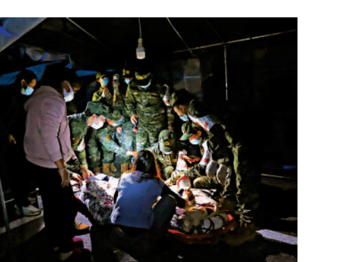
▲武警四川總隊醫院醫療隊在瀘定縣救治傷員。新華社