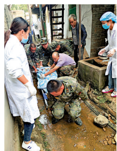
▲武警四川總隊雅安支隊執勤四中隊官兵在石棉縣救助被困群眾。