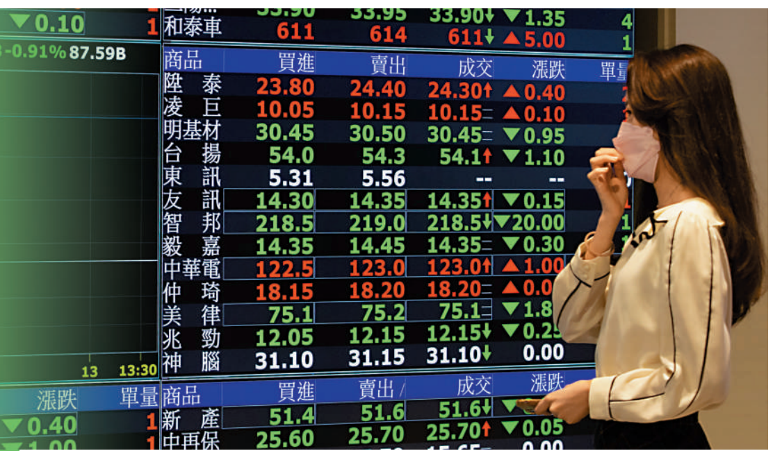
島內外資近月持續外流。台股成為外資的「提款機」。