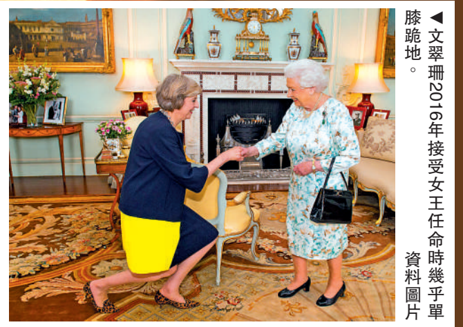
▲文翠珊2016年接受女王任命時幾乎單膝跪地。資料圖片