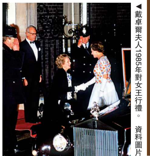
▲戴卓爾夫人1995年對女王行禮。