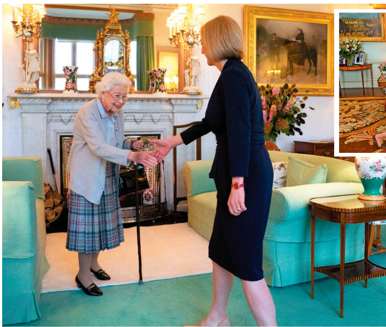
▲特拉斯6日觀見女王時行了「半個屈膝禮」。