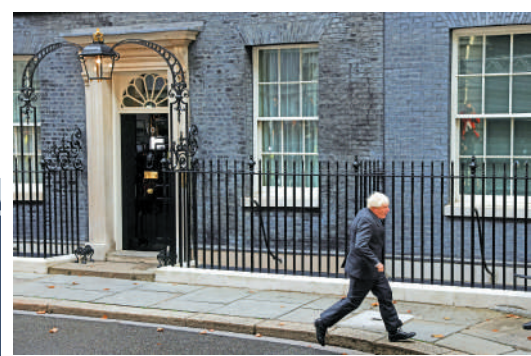
▲約翰遜6日發表告別演講後離開唐寧街。路透社

【大公報訊】綜合路透社、《衛報》報導: 約翰遜6日在唐寧街10號門前發表了他作為英國首相的最後一次演講。英媒分析指, 他多次暗示自己有意重返政壇。約翰遜6日向英國女王伊麗莎白二世正式遞交辭呈之前發表了告別演講, 大肆吹噓自己過去