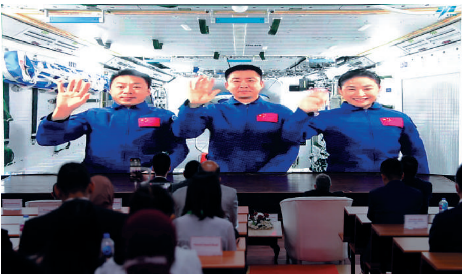
▲9月6日在埃及開羅拍攝的「天宮對話」活動埃及分會場。

本次「天宮對話」活動由中國駐非盟使團、中國載人航天工程辦公室與非盟委員會共同舉辦，是中國同非盟建交20周年慶祝活動之一。