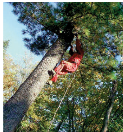
▲林場工人攀爬松樹採摘松子。

據悉，2022年8月31日，海林林業局有限公司已發出紅松種子採收安全提示，嚴禁用氫氣球等危險方式進行紅松種子採收。