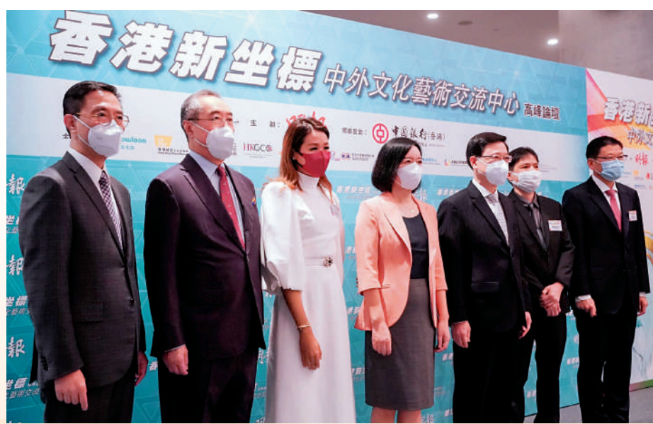
▲李家超(右三)、盧新寧(中)、楊潤雄(左一)等出席「香港新坐標：中外文化藝術交流中心」高峰論壇。