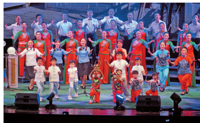
▲香港教師朗誦藝術團合唱《南泥灣》。

整場演出匯集合唱、獨唱、小組唱、民樂、管樂合奏、朗誦、舞蹈、話劇等節目形式，表達在國際形勢風雲變幻時，香港和祖國同舟共濟，戰勝任何困難的堅強決心。