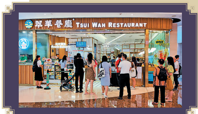
▲港餐飲老字號深受廣州年輕人歡迎。

粵港澳大灣區老字號（文化）博覽會、組織粵港澳三地老字號企業開展交流活動等。這些項目都為港資企業提供了平台和機會。在唐一瀚看來，方案出台對於港資老字號來說是一個很好的機會，例如翠華就可以充分利用「港味」這個特色，結合簡約現代風格，分別於櫃檯、休息區及以餐桌上擺放網紅打卡裝飾品等方式，通過差異化的創新參與其中。