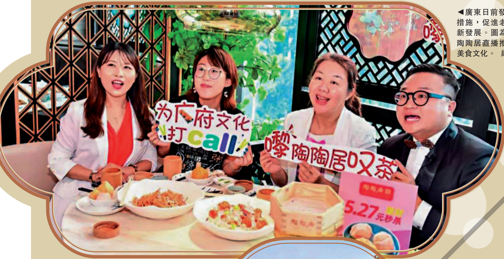
◀廣東日前發布22條措施，促進老字號創新發展。圖為老字號陶陶居直播推廣廣東府美食文化。

這些項目，不少與港澳相關，如建設大灣區（廣東）老字號博物館、邀請全國各地和港澳地區老字號企業參加