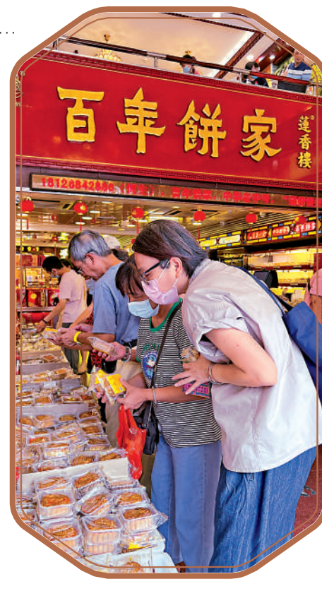
▲百年餅家至今依然吸引市民遊客光顧。

老字號走出老城區。今年3月，首個廣州老字號優選手信集合展示店在廣州花城廣場揭幕，首批進駐的老字號及廣州手信企業包括廣氏菠蘿啤、利工民服裝、第一福珠寶、五羊錶業（前身廣州手錶廠）等。廣州首個集中展銷老字號產品的專櫃——廣州老字號館，日前也在一大型商場開張迎客。白雲山潘高壽、泮塘食品、利工民、鷹金錢、寶生園、紅棉、廣氏菠蘿啤、正氣茶、港三元等十幾家企業進駐老字號館，現場提供超過60款老字號產品供市民遊客選購和參觀。