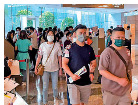
▲近日不少新盤以低市價開賣，對二手樓市場帶來巨大壓力。

政商界的求變的聲音已經愈來愈響亮，經濟與樓市皆亟待特區政府提出放寬措施挽救。正是「兼聽則明，偏信則暗」，希望特區政府聽取各界意見，於10月公布的施政報告中提出更多有效「救港」措施。作為香港特區政府新特首，李家超任內首份施政報告，全港市民都引頸以待。上屆特區政府已經先後兩次放寬按揭保險成數，希望新特首可以延續放寬樓市政策，就算不減辣，亦應該推出更多惠民措施，以振奮經濟，又或進一步落實對內通關的時間表。短期而言，只有施政報告推出「派糖」或「減辣」的良好消息刺激，樓價才有扭轉跌勢的機會。