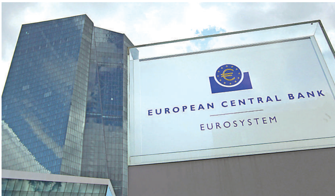
►為抗通脹，歐央行預料會繼續大手加息。

歐央行9月加息0.75厘，並明確未來加息進程將繼續推進，在通脹壓力可能進一步走高，且存在高度不確定性的背景下（歐洲通脹率年內可能破10%），年內歐央行同樣可能執行「沃爾克式」的加息，以連續大幅度、超預期的緊縮力度打壓通脹，10月議息會議同樣存在加息0.75厘的可能性。歐央行加速緊縮可能進一步提升歐債風險。