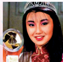
▲張曼玉1983年參選港姐獲亞軍。