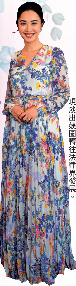
◀朱千雪為2022年港姐季軍，現淡出娛圈轉往法律界發展。