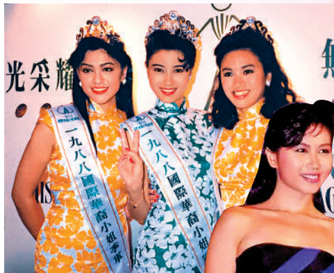
▲1988年港姐冠軍李嘉欣(中)同年參選國際華裔小姐，同樣奪冠。