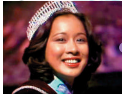
▲朱玲玲1977年當選港姐冠軍。