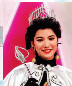
▲袁詠儀為1990年港姐冠軍，隨後轉往影圈發展。