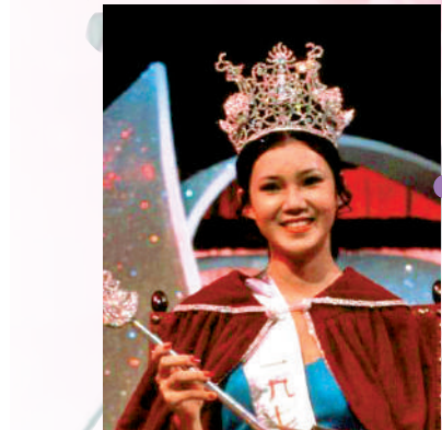
▲孫泳恩1973年參選港姐奪冠，時年18歲。