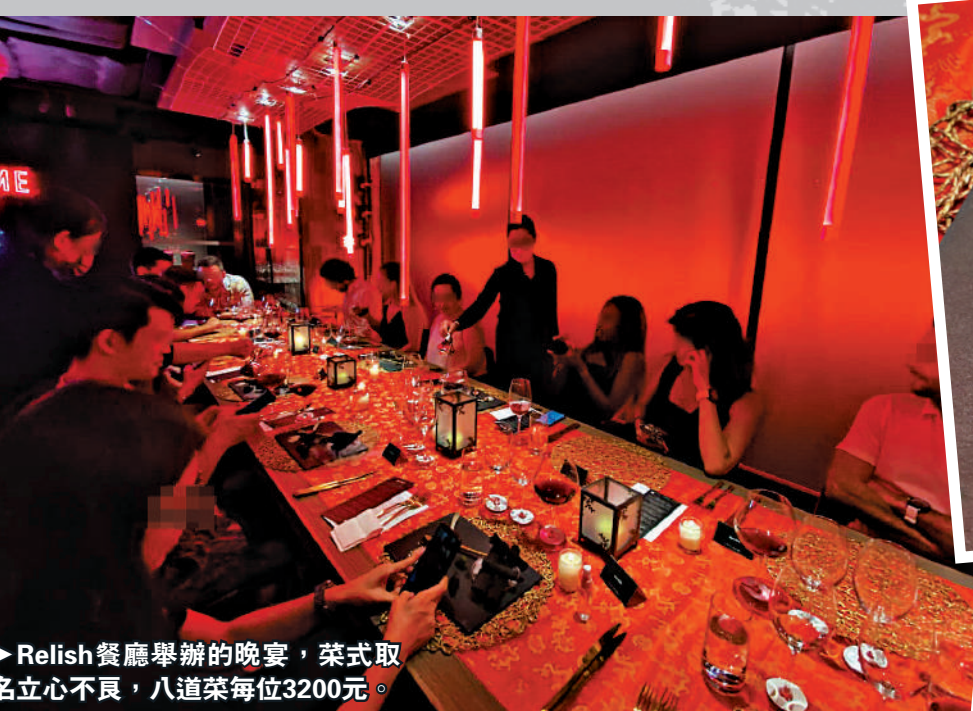
► Relish餐廳舉辦的晚宴，菜式取名立心不良，八道菜每位3200元。