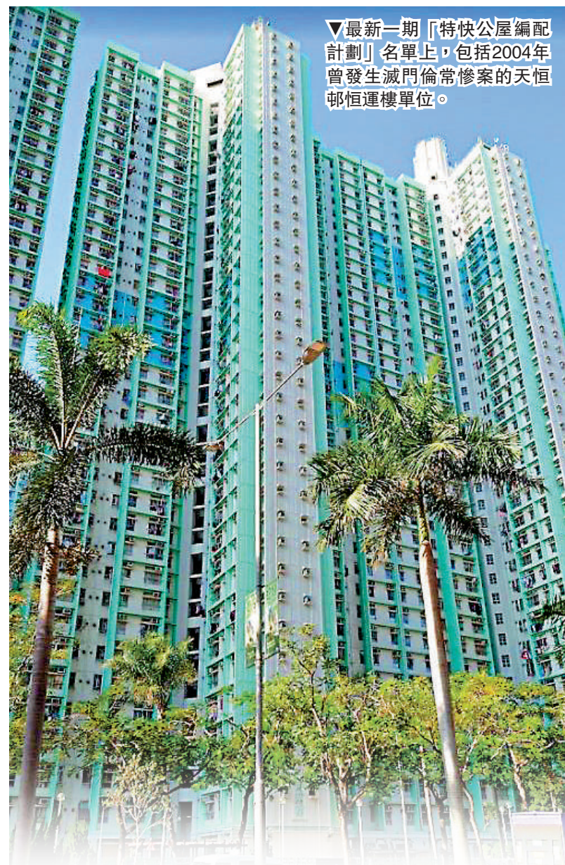
▼最新一期「特快公屋編配計劃」名單上，包括2004年曾發生滅門倫常慘案的天恒邨運樓單位。

「特快公屋編配計劃」是原有公屋申請以外的一個額外計劃，透過該計劃，符合資格的公屋申請人將可獲得提早入住公屋單位的機會。在這計劃下可供揀選的單位，分布於全港各區，大部分是受歡迎程度較低的公屋，部分曾涉及不愉快事件，例如追討欠債、自殺、意外死亡、自然身故等，今年有約2000個單位。