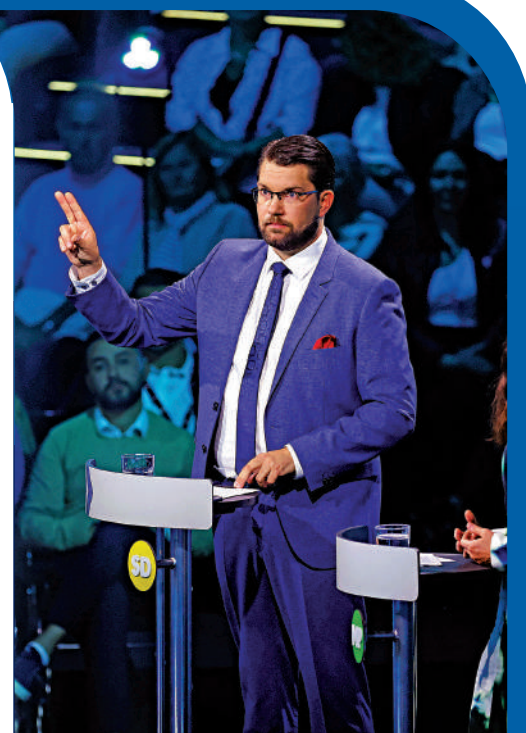
▲瑞典民主黨領袖奧克松8日出席電視辯論。

【大公報訊】綜合路透社、美聯社、彭博社、BBC、《金融時報》報導：北歐國家瑞典今日迎來史上最激烈議會選舉，社會民主黨所領導的執政中左政治聯盟可能會被在野的右翼陣營拉下馬，而極右民粹主義政黨、瑞典民主黨更有望成為議會內第二大政黨，引發政壇地震。本次大選主題主要聚焦於難民政策、飆升的電費和幫派槍支暴力案發生，民眾飽受其苦。分析認為，本次大選將成為未來歐洲多國選舉的風向標，極右民粹派可能上台，改寫歐洲政治版圖。