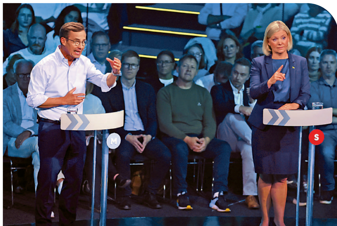
▲8日，瑞典溫和黨領袖安德松(右)和黨領袖克羅斯特森(左)出席電視辯論。