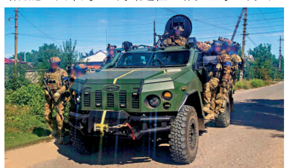
▲烏克蘭軍隊10日在東部重鎮庫皮揚斯克乘坐坦克巡邏。

口的糧食，只有3%流向了最貧窮的國家。普京表示，今年5月至8月，俄羅斯出口700萬噸化肥，其中約300萬噸運往亞非拉國家。而出口