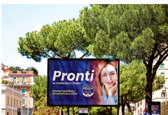
▲意大利街頭懸掛的意大利兄弟黨女黨魁梅洛尼的宣傳標語。路透社

【大公報訊】綜合路透社、美聯社報導：由於總理德拉吉辭職，意大利將於9月25日提前舉行全國大選。目前，極右翼政黨意大利兄弟黨支持率位列第一，高達25%。而該黨女黨魁梅洛尼也成為下任總理的熱門人選，有望成為該國史上第一位女總理。