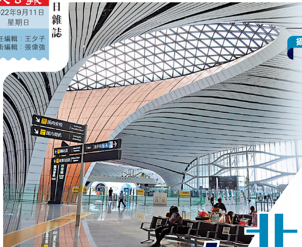
▲北京大興機場航站樓裏標誌性的C形柱，是遊客拍照打卡的最愛。