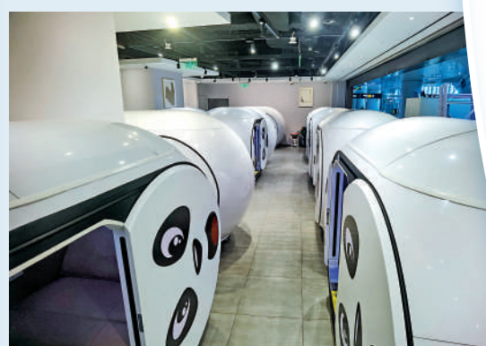
▲機場內設計成熊貓造型的「刻睡休息館」提供了休憩的空間。