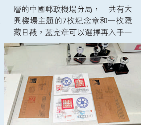
▲不少北京市民專門來到大興機場進行「集章之旅」。

如今，年輕一代都喜歡「集章旅行」，每走訪一處景點，拿出「集章本」蓋上一個印，既能留下到訪的痕跡，也彰顯景點之間的不同特色。大興機場也趕上了這波熱潮。來機場觀光的遊客可以在首圖分館免費領取「老北京胡同」「故宮」等主題的文化明信片，遊客可在機場各處加蓋特色印章，用來銘記旅途、承載回憶。集章之旅的第一站是同在一個