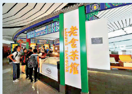
▲人們可以在餐飲店如「老舍茶館」品嚐「地道京味兒」。