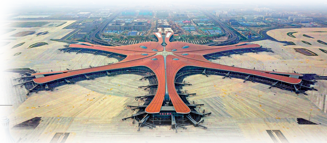
▲無人機拍攝的北京大興國際機場航站樓。

航站樓三層的「興禮遇」是國內首家機場主題文創店，獨家售賣80餘種大興機場IP文創商品。從旅行箱、帽子到筆記本等，都將機場的C形柱、穹頂結構等元素融入到設計中。店員介紹，銷量最好的產品是印有「航站樓天窗」圖案的陶瓷杯，此外，經濟又好用的環保袋也是個不錯的選擇。一番血拚之後，來上一支造型獨特的「興禮遇」文創雪糕，暢遊機場的美好回憶，也融化在唇齒之間。