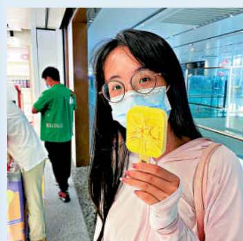
▲「興禮遇」推出的文創雪糕還原了大興機場的建築外觀。