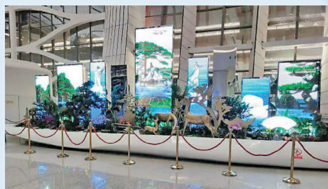
▲「鹿鳴」寓意機場歡迎來自八方四海的遊客。

從北京市區乘上地鐵大興機場線，只需不到20分鐘就能直達機場，開啟一日打卡之旅。在社交平台「小紅書」上搜索「大興機場」話題，不難見到有博主換上應景的服裝，與網友分享大興機場最適合拍照的打卡點，其中以科技感十足的C型柱最受歡迎。