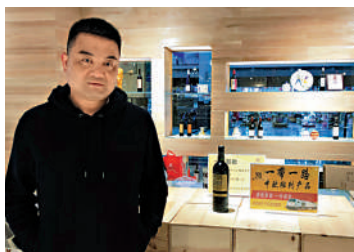
▲金海軍表示，中歐班列進口商品成為更優質的代名詞。

任感和好評度都增加了。有代理商跟我說，以前覺得『一帶一路』、『中歐班列』離我們很遠，但看到這些產品之後，才感覺到就在我們身邊。」