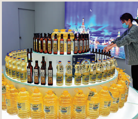
▲中歐班列進口的商品暢銷中國市場。

同時，《報告》顯示，截至2021年底，中歐班列累計開行4.9萬列，運輸貨物443.2萬個標箱，中國境內已有91個城市開通中歐班列。中國鐵路在境外18個國家建立了87個集裝箱堆場，覆蓋了絕大部分中歐班列境外節點城市。