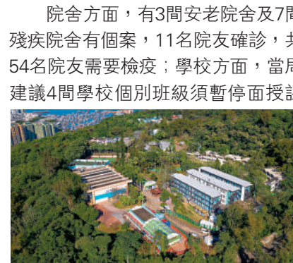
▲衛生署表示，西貢戶外康樂中心已預留予猴痘確診個案的密切接觸者進行檢疫。

介乎61至93歲，全部都有長期病患或癌症。當中5人未曾打針，另有5人未打三針；第五波疫情至今累計9597人離世。醫管局總行政經理（病人安全及風險管理）何婉霞再次提醒市民，如未接種疫苗，或只打一針，都要按時接種，強調要打齊疫苗才能產生效果。 院舍方面，有3間安老院舍及7間殘疾院舍有個案，11名院友確診，共54名院友需要檢疫；學校方面，當局建議4間學校個別班級須暫停面授課