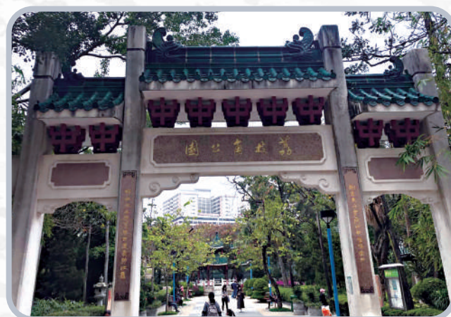
▲荔枝角公園入口牌坊楹柱兩旁的對聯，是由本港學者何文匯教授於2004年農曆十月所撰。

下聯由「荔枝角公園」的「荔枝」而聯想到楊貴妃（719-756）。楊貴妃，唐代蒲州永樂（今山西永濟）人，是唐玄宗（李隆基，685-762）的寵妃。楊氏起初是玄宗第十八子