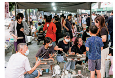
▲中秋節後，島內疫情急速升溫。圖為台民眾在中秋節烤肉。

在13日的記者會上，台當局「流行疫情指揮中心」發言人介紹，當天（周二）增加的個案數相比上週二增加28%。