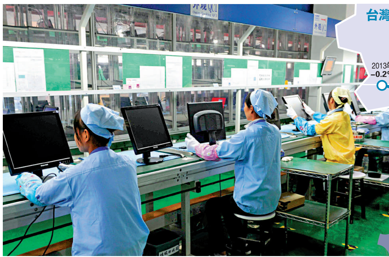
台灣地區面板產業增長率

【大公報訊】據中通社報道：韓國電子廠商與中國大陸公司的密切合作，讓一些台灣企業有了競爭壓力。台媒報道，三星將旗下多個液晶面板專利轉讓給陸企，與三星原本有合作關係的台企訂單恐被壓縮。兩岸學者指出，近年來全球面板產能不斷往中國大陸轉移，韓國、中國台灣地區都在爭取或者分享大陸市場所帶來的紅利。但由於台灣當局配合美國戰略遏制中國大陸，要台企和大陸市場脫鉤，導致台灣面板業在對大陸投資、技術轉讓等方面裹足不前，失去商機。