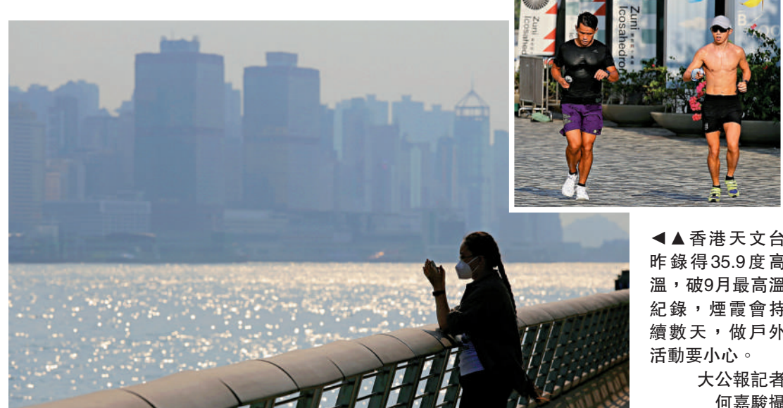
▲香港天文台昨錄得35.9度高溫，破9月最高溫紀錄，煙霞會持續數天，做戶外活動要小心。