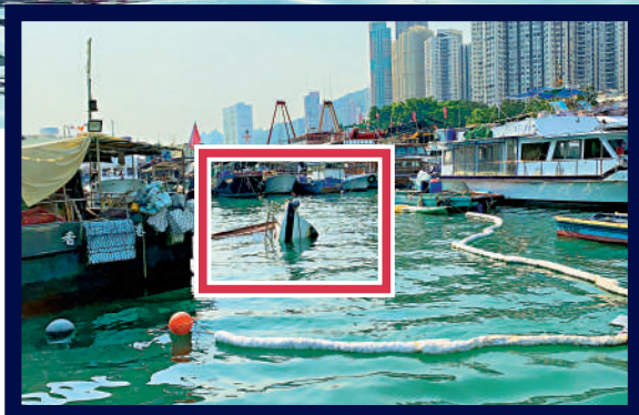
▲香港仔避風塘連環沉船位置昨日以浮條包圍，中間一艘遊艇沉沒後只剩船頭一截露出海面（紅框示）。

其中一艘涉事船隻的女船主表示，其沉沒的纖維船俗稱「網艇」，長28呎，她的丈夫曾於前晚