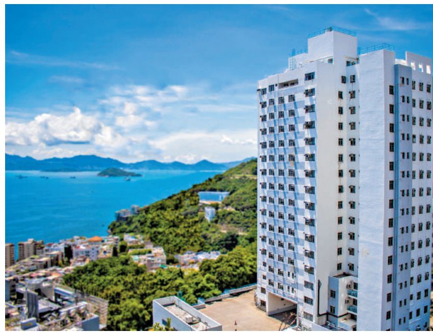
香港政研會及香港大學畢業生聯席到警察總部，舉報港大學生欺凌內地女生。