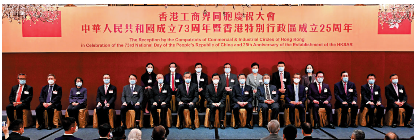
▲香港工商界同胞慶祝大會於港島香格里拉大酒店舉行，嘉賓與一眾香港工商界人士聚首一堂，慶祝中華人民共和國成立73周年和香港特區成立25周年。

從1949年新中國成立以來，中華民族走上了實現偉大復興的壯闊道路。國家在過去73年長足發展，在經濟上成就非凡，國際影響力不斷擴大。