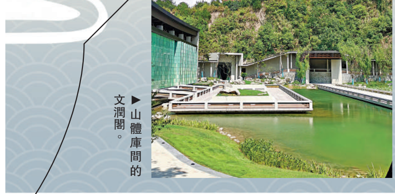
►山體庫間的文潤閣。