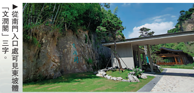
►從南門入口處可見東坡體「文潤閣」三字。