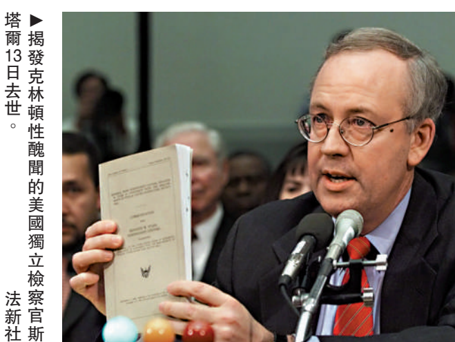
塔爾13日去世。揭發克林頓性醜聞的美國獨立檢察官斯塔爾。

【大公報訊】綜合《華盛頓郵報》、路透社報道: 美國獨立檢察官斯塔爾因手術併發症於當地時間9月13日去世, 終年76歲, 他當年因參與前總統克林頓的「白水門」事件, 揭發白宮實習生萊溫斯基性醜聞調查而家喻戶曉。