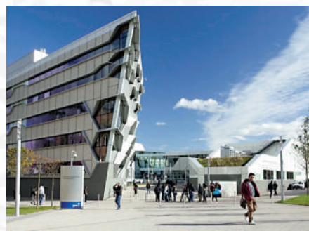
▲倫敦考文垂大學是英國少數有開辦環球商業管理（榮譽）學士學位的大學。

考文垂大學更設有國際銜接課程，如國際預科課程（IFY），成功完成中五並取得相關科目及格成績或香港中學文憑考試並取得3門相關科目的及格成績。