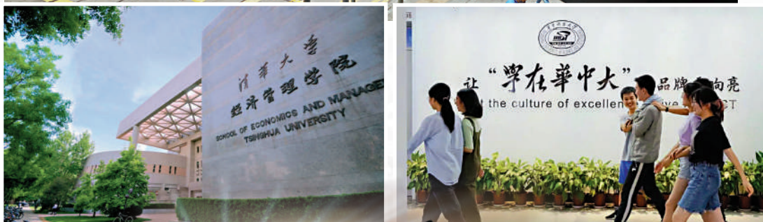
▲清華大學經管學院於2007年開設「經濟與金融」專業。