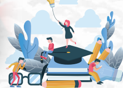
▶中山大學的經濟學專業目標培養複合型經濟管理精英。