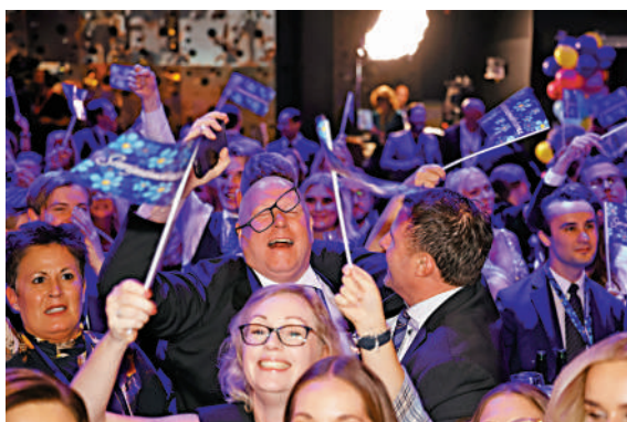
▲瑞典極右翼民粹主義政黨的支持者慶祝右翼陣營獲勝。