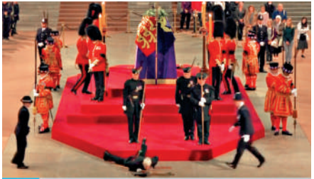
▲一名英國士兵（前排中）在為女王守靈時暈倒。

據悉，負責為英女王守靈的衛兵每20分鐘會進行一次交接。BBC的直播畫面顯示，一名男性衛兵先是身體微微晃動，還曾短暫走下台階，接着重新站回位置。午夜過後，正當身穿紅色制服的其他衛兵交接從兩側走上台階時，他的身體再度開始搖晃，幾秒過後就以臉朝