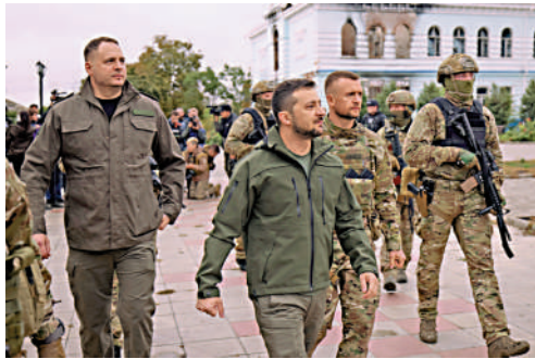
▲烏克蘭總統澤連斯基14日視察伊久姆（中），回程中出車禍。

鄉、烏克蘭中部最大城市克里維里赫14日被8枚巡航導彈襲擊，其中卡拉楚諾夫水庫大壩被擊中，水庫的儲存水以每秒100立方米的速率洩漏，古萊茨河下游河水暴漲，當局要求居民緊急撤離。克里維里赫市戰前人口約65萬，烏克蘭總統辦公室副主任季莫申科在網上發文稱，這次襲擊沒有造成平民傷亡。克里維里赫市軍政首長維爾庫爾發文稱，112戶家庭被洪水淹沒，不過大壩的修復工程已經開展，洪水逐漸消退。