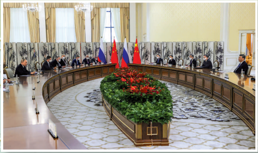
▲15日下午，中國國家主席習近平在烏茲別克斯坦撒馬爾罕國賓館同俄羅斯總統普京舉行雙邊會見。美聯社

中方願同俄方在涉及彼此核心利益問題上相互有力支持，深化貿易、農業、互聯互通等領域務實合作。雙方要加強在上海合作組織、亞信、金磚國家等多邊框架內的協調和配合，推動各方增進團結互信，拓展務實合作，維護本地區安全利益，維護廣大發展中國家和新興市場國家共同利益。