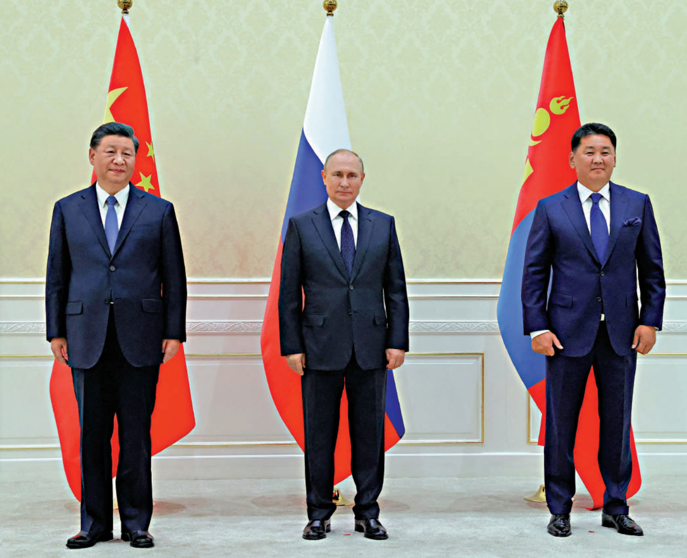
▲9月15日，中國國家主席習近平、俄羅斯總統普京、蒙古國總統呼日勒蘇赫在烏茲別克斯坦撒馬爾罕舉行三方會晤。

習近平指出，今年以來，中俄保持了卓有成效的戰略溝通。兩國各領域合作穩步推進，體育交流年活動有序展開，地方合作和人文交流更加熱絡，在國際舞台上密切協調，維護國際關係基本準則。面對世界之變、時代之變、歷史之變，中方願同俄方一道努力，體現大國擔當，發揮引領作用，為變亂交織的世界注入穩定性。