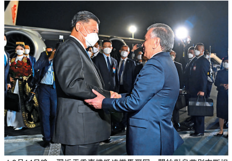
▲9月14日晚，習近平乘專機抵達撒馬爾罕，開始對烏茲別克斯坦進行國事訪問。

訪問期間，中國、吉爾吉斯斯坦、烏茲別克斯坦有關部門簽署《關於中吉烏鐵路建設項目（吉境內段）合作的諒解備忘錄》。