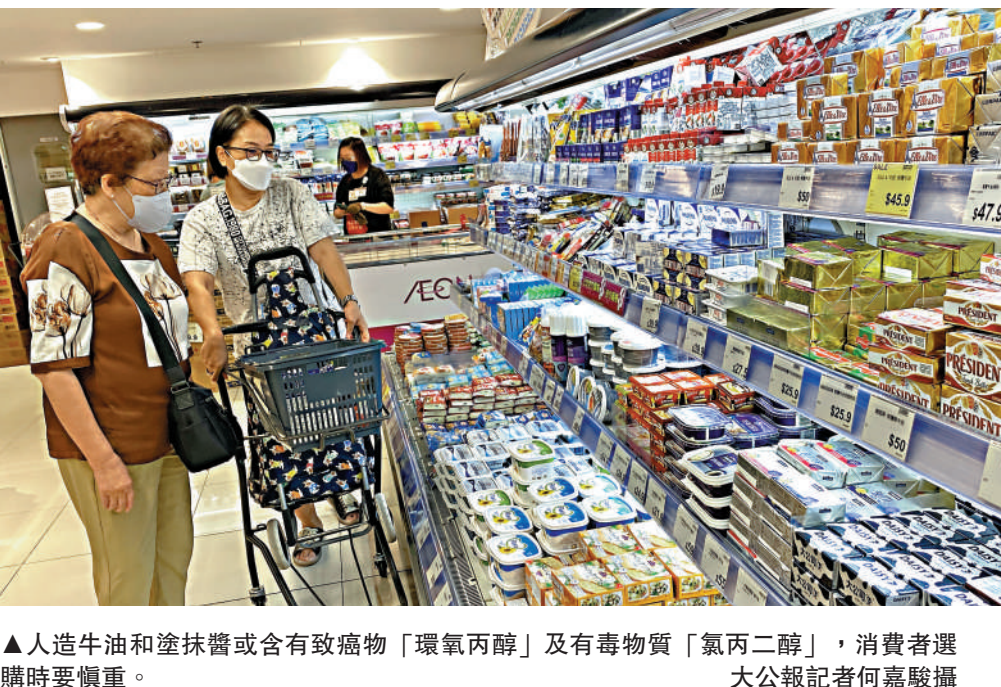
▲人造牛油和塗抹醬或含有致癌物「環氧丙醇」及有毒物質「氯丙二醇」，消費者選購時要慎重。

消委會測試28款樣本，涵蓋12款牛油及16款人造牛油及塗抹醬。結果發現12款牛油均未檢出致癌物「環氧丙醇」，但16款含植物油成分的人造牛油及塗抹醬樣本中，15款均有檢出。其中，品牌 earth balance 的 Original Buttery Spread 的「環氧丙醇」含量高達每公斤1500微克，超出歐盟標準的每公斤1000微克。 16款含植物油成分的人造牛油及塗抹醬樣本中，有13款樣本檢出「氯丙二醇」，而檢出量的差異頗大。以每公斤計算，最低含量為77微克，最高含量為1200微克，相差逾14倍，惟沒有超出歐盟標準上限，在正常分量下食用，應不會構成健康風險。 消委會總幹事黃鳳嫻表示，動物實驗證實，「氯丙二醇」有機會損害腎臟功能、中樞神經系統及雄性生殖系統；而「氯丙二