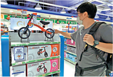
▲兒童平衡車可以鍛煉平衡及神經反射能力，不少父母會為子女選購。

美研究結果，指出DEHP或損害男性生殖系統，孕婦接觸亦可能影響胎兒發育。 至於機械及物理性能測試，6個樣本未能完全符合歐洲玩具安全標準的要求，其中「cannondale」、「FirstBIKE」及「Huffy」樣本在拉力或扭力測試下產生細小部件，兒童或有機會在好奇下誤吞。 海關表示，已對6款未能通過歐洲標準測試的產品作出跟進，發現其中4款已下架及在市面上已停止供應；至於另外2款，海關在試購後交與政府化驗所進行測試，結果顯示符合《玩具及兒童產品安全條例》的安全要求。