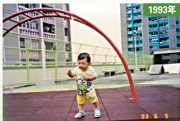
▲▼阿楠自小在華富邨長大，最難忘小時候常與小夥伴們一起在邨內玩耍冒險。

「最可惜的，就是大家搬遷了，各散東西，現時的鄰里關係可能會消失。」阿楠說，自己家的鑰匙，隔壁家都會有，這是20幾年老街坊和上一代人才會有的人情味和信任。現在新搬進來的家庭，出門都不會互相打招呼，新一代的人比較冷漠，也不會輕易與人建立信任關係，「所以這一份鄰里關係的消失，應該是令我最為不捨的……」