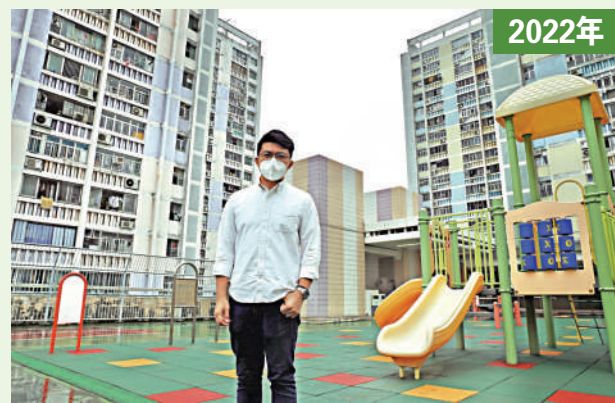
▲▼阿楠自小在華富邨長大，最難忘小時候常與小夥伴們一起在邨內玩耍冒險。