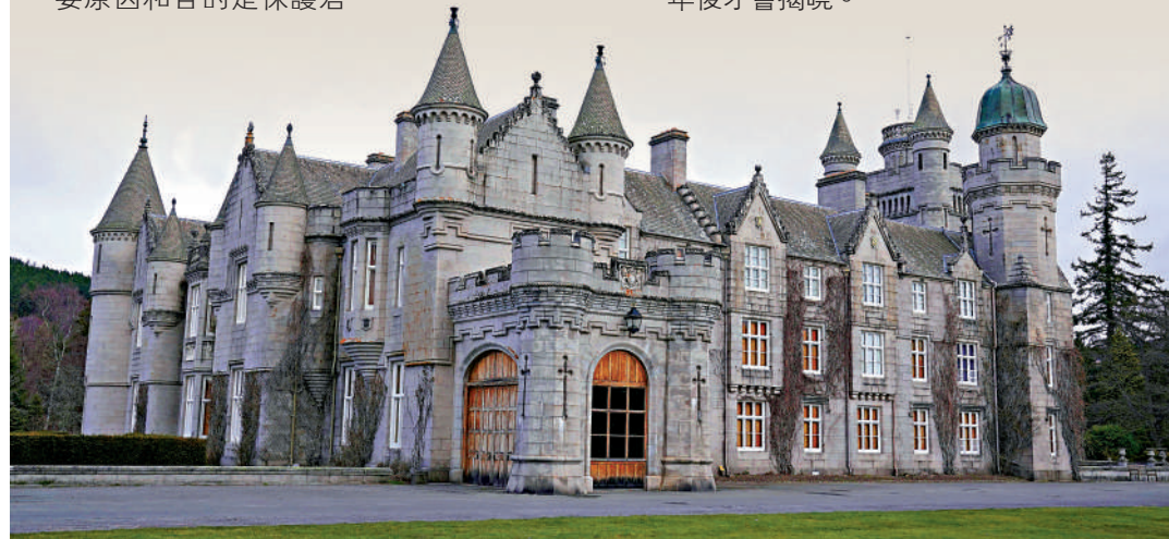
▲英女王逝世時所在的巴爾莫勒爾堡屬於她的私人財產。

路透社指出，這些細節此前不為人所知，直到2021年4月，英女王的丈夫菲臘親王去世後才被揭曉，現任倫敦高等法院家事分庭庭長麥克法蘭透露了保險箱的存在，麥克法蘭表示，由他負責保管保險箱，但他從沒看過密封好的遺囑文件。目前保險箱內有超過30封王室成員遺囑，包括伊麗莎白二世、菲臘親王、伊麗莎白皇太后、瑪格麗特公主等，預計至少90年後才會揭曉。