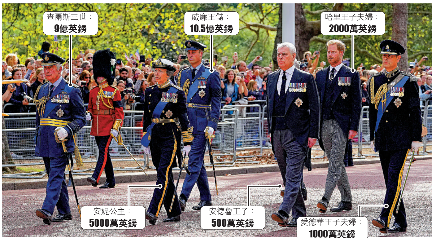
▲英國王室成員14日護送女王靈柩前往威斯敏斯特宮。

《泰晤士報》17日發文指出，由於英國君主毋須公開私人財產，王室的總資產和各成員的個人財產很難確切計算，根據該報掌握的資料，英國國王查爾斯三世身家9億英鎊，威廉王儲身家10.5億英鎊，安妮公主擁有5000萬英鎊、安德魯王子擁有500萬英鎊、愛德華王子夫婦擁有1000萬英鎊、哈里王子夫婦擁有2000萬英鎊。