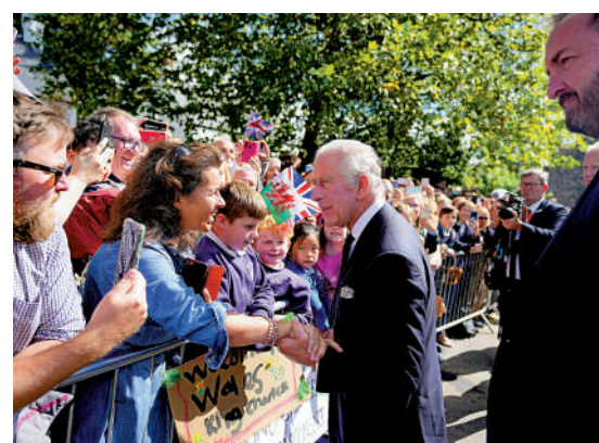
▲查爾斯三世16日與民眾會面時，被當場批評王室開銷過大。

據英媒報道，隨着生活成本危機加劇，更多英國人開始思考是否應該繼續為王室舉辦各種奢侈的活動，反對君主制的聲音也越來越大。