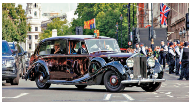
▲查爾斯三世及妻子卡米拉12日乘坐英女王愛車勞斯萊斯幻影IV出行。網絡圖片

2013年，下議院公共賬戶委員會要求，財政部應更密切地審查康沃爾公國的財產情況，並警告稱王室免徵遺產稅意味着「競爭企業面臨不公平的經營環境。」《泰晤士報》日前轉載一篇1992年的文章，顯示當時的工黨曾對王室免遺產稅、英女王有權解散議會等特權發起挑戰，要求取消王室一切特權。此事曾引起工黨與保守黨的大辯論，最終以1993年協議達成告終。