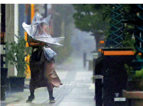
▲日本18日遭遇超強颱風，民眾在室外寸步難行。

【大公報訊】綜合共同社、美聯社報道：超強颱風「南瑪都」於當地時間18日18時在日本鹿兒島縣鹿兒島市附近登陸，日本氣象廳發布最高級別氣象警報。據當地消防局消息，宮崎縣、熊本縣、鹿兒島縣、廣島縣、高知縣出現房屋受損、樹木倒地的情況，上述地區約有20人在颱風中受傷。