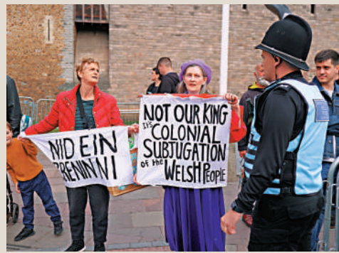
▲女王去世後，反君主制示威在英國此起彼伏。