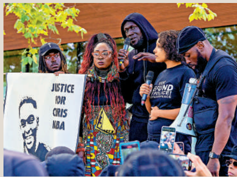
▲非裔男子被警察射殺案在英國多地引爆示威，警方壓力進一步增加。