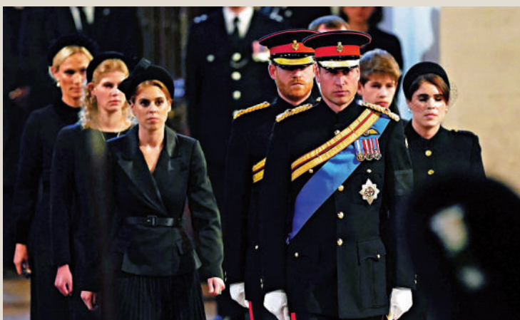
◀女王的孫輩17日在威斯敏斯特禮堂為她守靈。