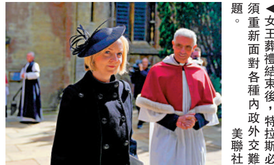
◀女王葬禮結束後，特拉斯必須重新面對各種內政外交問題。

彭博社還指出，特拉斯主張推翻英國脫歐協議中的《北愛爾蘭議定書》，引起歐盟強烈不滿，女王葬禮結束後英歐矛盾將再次爆發。美國總統拜登亦不滿特拉斯在北愛問題上的做法，英美之間的所謂「特殊關係」面臨考驗。21日，特拉斯將與拜登會晤，外界關注兩國關係將走向何方。