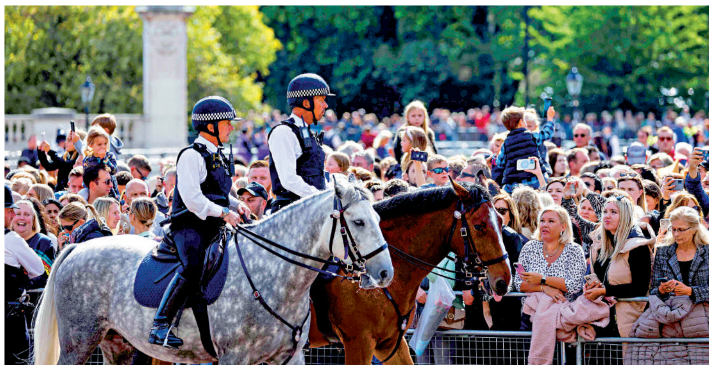
◀英國女王國葬即將舉行，警察18日在白宮附近騎馬巡邏。

【大公報訊】綜合《衛報》、BBC、美聯社報道：英國女王伊麗莎白二世的國葬於19日舉行，來自全球近200個國家和地區的約500名重要外賓齊聚倫敦威斯敏斯特大教堂，美媒形容這是一場「安保噩夢」。據報道，英國19日將出動超過1萬名警察和數百名軍方人員，應對這次史無前例的挑戰。英媒披露，除了潛在的恐怖襲擊風險外，倫敦等多地近日發生反君主制和反種族主義示威，為安保工作帶來更大壓力。