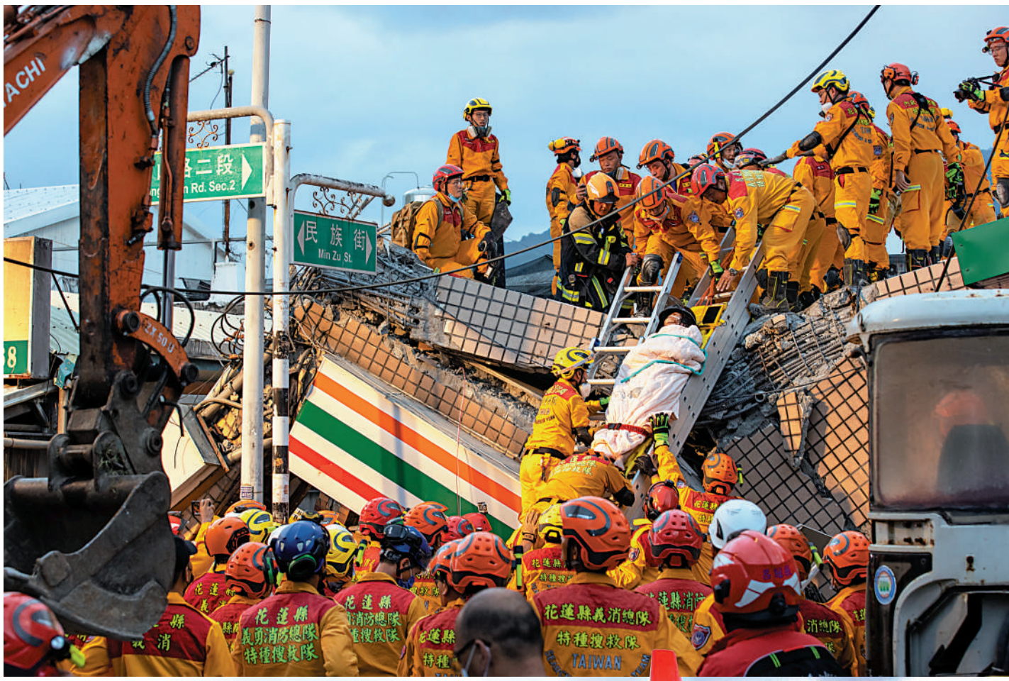
▲花蓮玉里鎮中山民族路口一棟三層樓18日在震中倒塌，特搜隊救出受困民眾。

【大公報訊】台灣地區台東縣繼17日夜間發生里氏6.4級地震後，18日又發生里氏6.9級地震。此次地震在多地造成民宅倒塌、橋樑斷裂，共造成1死79傷。此外，花蓮赤科山道路坍方中斷，山上有近400名遊客受困。此次地震屬陸地淺層地震，除了全台灣震感強烈，香港、福建、廣東、江蘇、上海等沿海地區震感明顯。對於台灣地震發生災情，國台辦發言人朱鳳蓮18日表示，大陸有關方面對此高度關切，並向遇難人員家屬表示哀悼，向受傷人員表達慰問，希望受災民眾早日恢復正常生活秩序。