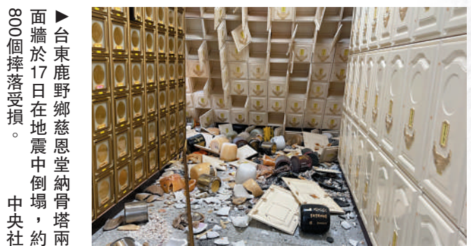
▲台東鹿野鄉慈恩堂納骨塔兩面牆於17日在地震中倒塌，約800個骨灰罇受損。

此外，葉姓婦人與5歲女兒受困傾倒建物，幸虧靠手機通訊與先生取得聯繫，這才讓消防人員循聲定位，在事發3小時平安脫困。對於有網友質疑這幢倒塌的樓房「偷工減料」，當地居民說法，這棟建物屋齡近40年，屋主曾出租套房，樓下租給便利店使用，是否因為1樓超商店面改成玻璃墊面，讓原本牆面、樑柱支撐力減弱不得而知。