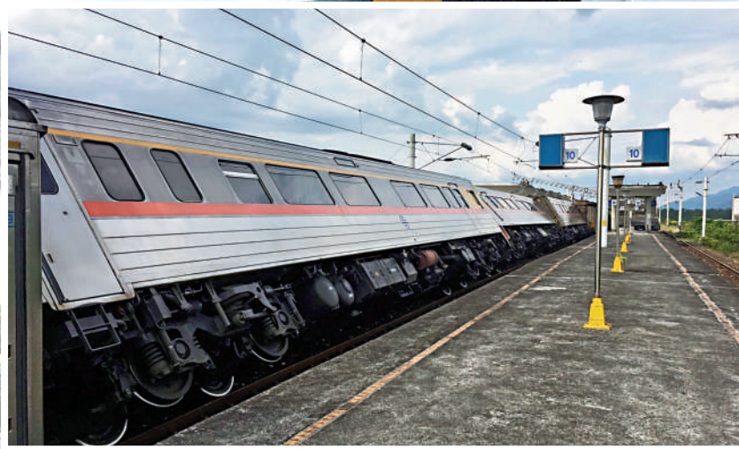
▲台鐵列車被震翻傾斜。