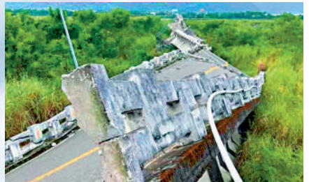
▲花蓮縣玉里鎮高寮大橋在地震中扭曲變形、斷成數截。

綜合中通社、中新社及台媒報道：17日夜間台東縣發生里氏6.4級地震，震中位於台東縣關山鎮，18日14時44分台東縣池上鄉又發生一起6.9級地震，震源深度7千米，全台皆有震感。台灣地區氣象部門有關負責人表示，18日這起地震才是主震，相關餘震恐持續一個月。