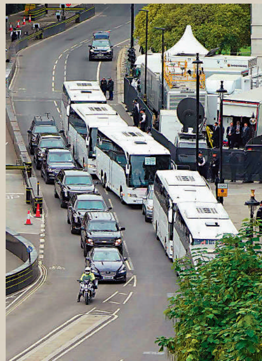
▲美國總統拜登的車隊駛過倫敦街頭，途中遇到塞車。