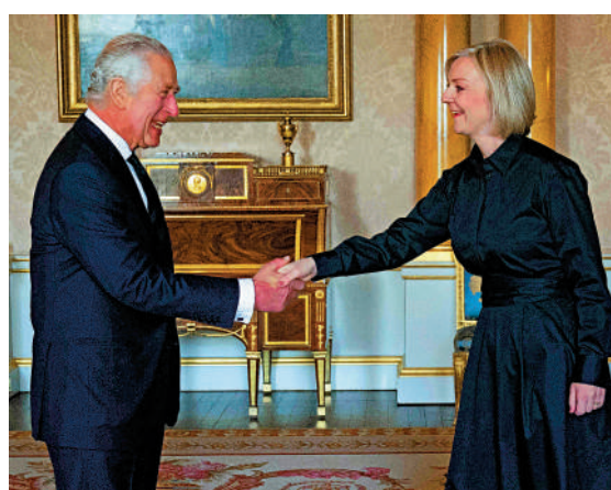
▲英國國王查爾斯三世（左）與首相特拉斯政見不合。

據另一位消息人士透露，哈恰圖良在現場大聲呼叫，與隨行人員說笑，一位在現場的與會者告訴《太陽報》，當時禮堂內有數百人，但其他人都沒有說話。有其他目擊者表示，哈恰圖良的做法「非常不尊重人」，除了他以外，「每個人都努力遵守這些嚴格的規定。」