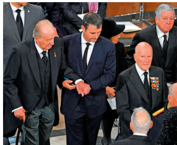
◀日本德仁天皇和皇后雅子等各國王室成員19日抵達威斯敏斯特大教堂。▲西班牙前國王胡安·卡洛斯一世（左一）被攙扶入場。