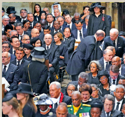
▲美國總統拜登等來自世界各地的政要19日出席英女王國葬。