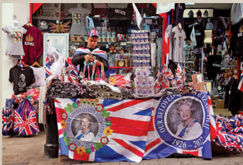
▲英國的很多旅遊紀念品上印有女王肖像。

品牌可將認證徽章展示在產品包裝和廣告上，屬一大賣點。據統計，獲得認證的品牌平均營收額增加了10%。王室認證每5年就會重新審核，女王去世後，她生前最愛的約600個品牌，包括Burberry招牌格紋雨衣、古百利朱古力等均面臨失去王室認證的風險。它們必須獲得查爾斯三世的認可，否則須在兩年內移除認證標誌。