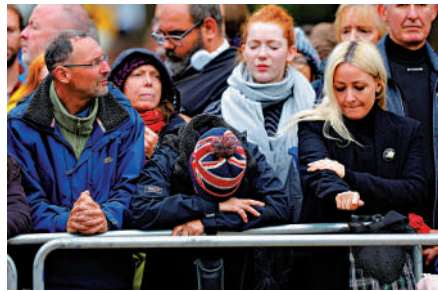
▲英國民眾19日在倫敦街頭悼念女王。