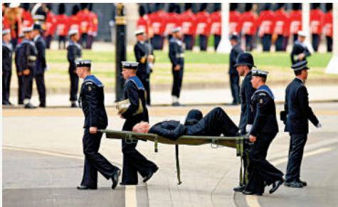
▲一名參與國葬安保工作的警察19日突然暈倒。