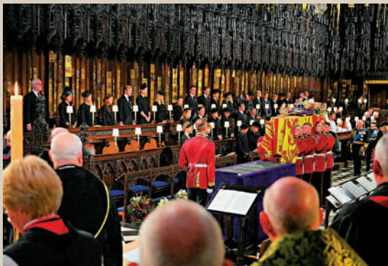
▲女王的送別儀式在聖喬治教堂舉行。