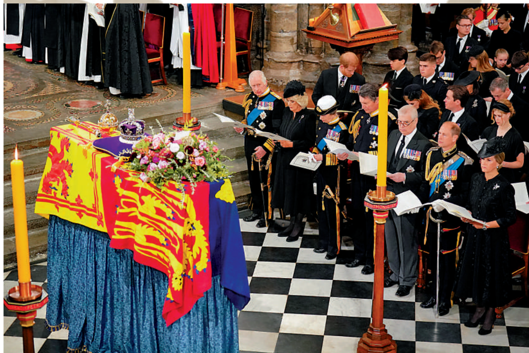
▲伊麗莎白二世的國葬19日在威斯敏斯特大教堂舉行。

女王去世後，大批民眾排隊瞻仰靈柩，官方為需要臨時離開隊伍者提供的紙質腕帶在eBay上被拍出7萬英鎊的高價。eBay表示這些物品違反了網站規定，將其下架。