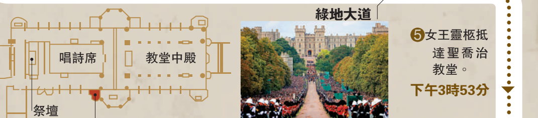
▲女王靈柩抵達聖喬治教堂。下午3時53分