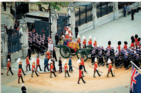
▲伊麗莎白二世的靈柩19日從威斯敏斯特禮堂移至威斯敏斯特大教堂。

另外，國葬前後發生不少小插曲。18日晚8時，英國民眾為女王默哀1分鐘，但本應在默哀開始及結束時鳴響的倫敦地標大本鐘卻陷入令人尷尬的沉默。英國議會發言人解釋說，這是因為「技術問題」，已經得到解決。19日國葬結束時，大本鐘按計劃敲響。