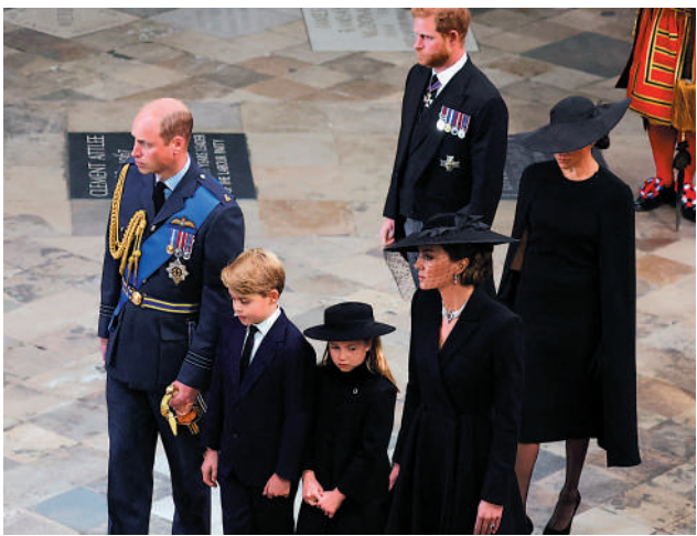
▲威廉王子夫婦19日帶著喬治王子（左二）和夏洛特公主（左三）出席女王葬禮。

【大公報訊】綜合BBC、《衛報》、美聯社報道：當地時間19日上午11時（本港時間19日下午6時），已故英國女王伊麗莎白二世的國葬在威斯敏斯特大教堂舉行，包括500名各國政要在內共計約2000人出席了葬禮。葬禮結束後，女王移靈溫莎堡，最終長眠於溫莎堡喬治六世國王紀念教堂。英國女王伊麗莎白二世為期十天的國葬落下帷幕，這場盛大的儀式耗資未公開，但外界估值至少是800萬英鎊。