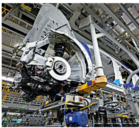
▲工人在韓現代汽車廠房內工作。

【大公報訊】綜合韓聯社、《金融時報》報道：拜登政府上月分別簽署總額達2800億美元和7500億美元的《芯片與科學法案》及《通脹削減法案》，重創韓國半導體及電動汽車企業。韓國國務總理韓德洙20日表示，美國政府歧視韓國製造電動汽車，有違美韓自貿協定中有關最惠國待遇的規定。