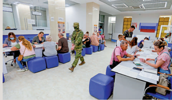
▲赫爾松民眾7月時登記資料申請俄羅斯公民身份。