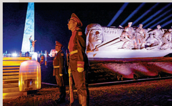
▲頓巴斯軍事歷史紀念館上周舉行紀念二戰活動。

當天，普京在與俄羅斯軍工業代表會談時表示，俄羅斯的武器有效對抗西方武器，「基本上北約所有的庫存都用來支持烏克蘭了。」普京說，俄羅斯要研究西方的武器來提升自身武器的威力。他下令官員們提升軍工業的產能，各組織必須按要求在最短的時間內交付武器和設備。