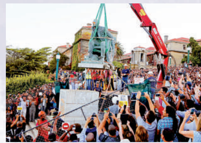
▲2015年，南非移除英國殖民者羅德斯的雕像。

為搶奪鑽石和土地，羅德斯還建立了一支私人武裝，殘忍屠殺了數以萬計的原住民。據報道，他曾從英國招募僱傭兵，並提供給他們馬克沁機槍，僅僅一個下午就殘殺了超過5000人。