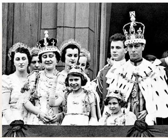
▲1937年，伊麗莎白二世的母親（左二）佩戴着「光之山」鑽石。

格里菲斯大學社會文化研究中心研究員巴塔查里亞指出，「光之山」等被偷走或搶走的珍寶是英國殖民和經濟掠奪歷史的縮影。據專家估算，英國殖民印度約200年間，掠走了多達45萬億美元的財富。