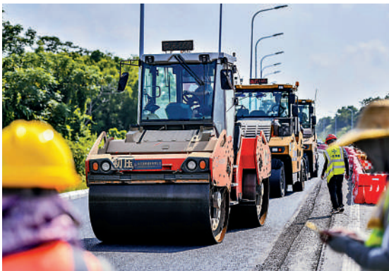
▲海南自貿港推進一系列重大基礎設施項目，包括G15瀋海高速海口段。

統計數據顯示，得益於自貿港政策的紅利，海南外貿外資增速取得歷史性跨越。貨物貿易方面，2021年增長57.7%，規模首次突破千億元；今年上半年，同比增長56%，增速快於全國46.6個百分點，居全國第二位。服務貿易方面，2021年增長