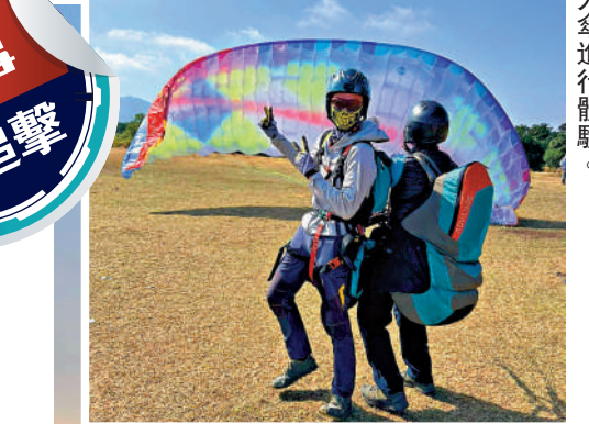
▲初學者應由專業教練帶領,先參加雙人傘進行體驗。

雷德博士表示,涉及滑翔傘導致傷亡的意外時有發生,始終滑翔傘是一項高危運動,初學者由專業教練帶領會安全得多。他建議初學者先參加雙人傘進行體驗,待具備一定的資歷及領取專業資格牌照後,才進行單獨滑翔。他解釋,滑翔傘運動涉及三項風險危機管理,包括個人本身的體能和經驗所操控,器材的狀態是否完善和良好,有否顧及後備裝置等,以及天氣方面的考慮,因環境因素決定了滑翔傘能否安全升降,若天氣不穩或欠佳絕不宜玩。翻查資料,過去三年(2019年至2021年)民航處共接獲11宗事故並作出跟進。