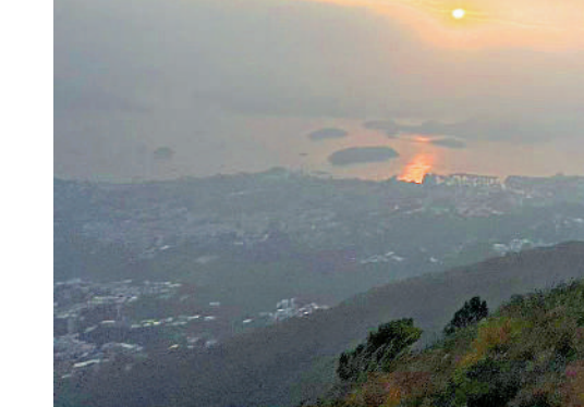
▲每逢周末假期,玩滑翔傘熱點如馬鞍山、石澳及大嶼山等人頭湧湧。