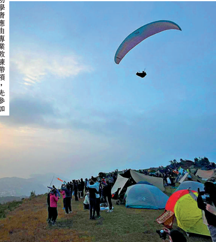
▲初學者應由專業教練帶領,先參加雙人傘進行體驗。