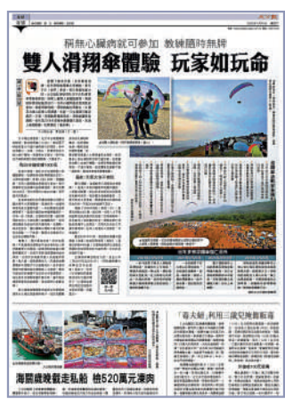
▲《大公報》早前報道玩滑翔傘深藏危機。

民航意外調查機構(AAIA)日前發表最新意外調查報告,包括講述去年12月石澳一宗滑翔傘奪命意外的原因,可能是一名七旬男飛行員失去對滑翔傘的控制,導致滑翔傘撞擊地面,飛行員頸部重創。當時該名老翁駕駛一款Ozone Buzz Z5滑翔傘,從石澳龍脊滑翔傘活動區起飛,計劃降落在石澳後灘泳灘,惟起飛後不久,有人發現他被困在香港島打爛堤頂山西面的灌木叢中,其後送院不治。死者是一名剛退休的的士司機,具約5年玩滑翔傘經驗。 該調查機構表示,這次調查滑翔傘意外發生的經過和成因,是為了避免同類事件再次發生。報告又建議有關機構,審視是否需完善現時滑翔傘安全指南中,頭盔的安全標準及使用期限,並表示相關人士已因應建議作出跟進行動。