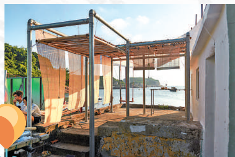
▲港大建築系定期辦作品展，早前該系師生及校友選取了香港四個偏遠的岸邊，築建以家為主題的建築。