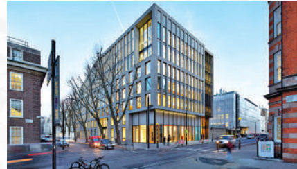
▲巴特萊特建築學院在QS的建築學科排名，長期位列三甲。

學生完成該課程後，在英國或海外的建築師樓工作一年，繼續接受培訓，即可成為註冊建築師。