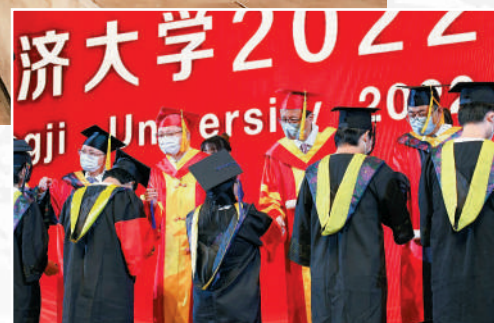
▲同濟大學建築系課程為培養具有創新思維、實踐能力及全球視野的綜合特質人才。