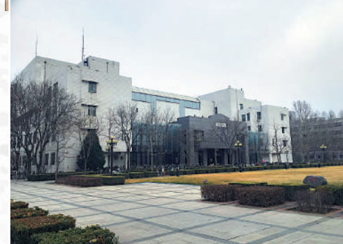
▲清華大學的建築專業享負盛名，歷年來培養出很多具有國際競爭力的建築精英。