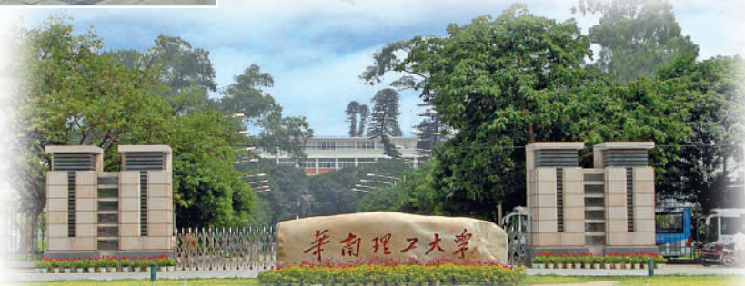
▲華南理工大學建築學課程，結合「專業基本能力培養」及「專業拓展與深化」。