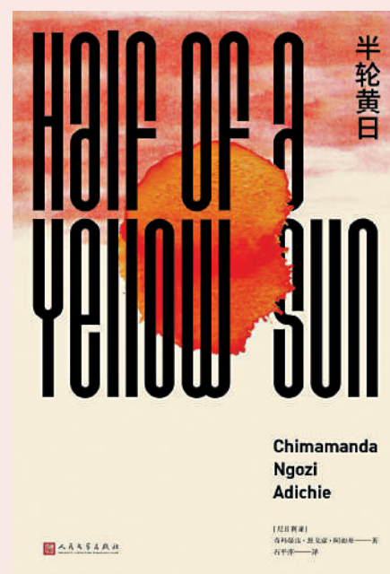
▲尼日利亞作家阿蒂奇著《半輪黃日》。

就連被西方稱道的伊麗莎白二世建立英聯邦是旨在推動殖民地和解，英國作家羅伯特·哈德曼在《伊麗莎白二世：女王的旅程》中提供了不同的視角。書中寫道：上世紀六十年代中期，英國負責英聯邦關係的國務大臣鄧肯·桑德斯發表演講，稱去殖民化是英國送給世界的禮物。他的演講是純粹的「英國乳母論」，把英國說成是一位自豪的母親，把嬰兒們養大成人，讓他們堅強獨立。席間，突然一個非洲口音的聲音打斷了他的講話，「得了吧，主席先生，讓我們彼此都坦誠一點。」他是剛獨立的馬拉維總統，他也是非洲獨立運動領導人之一。「你們英國人可不像其他帝國主義者那樣愚蠢，對於不可避免的事情，你們已及時認識到，並優雅地接受了它。但這並非都是出於你們自願。」然後他繞着桌子，指在場許多首腦，包括他本人說，這些人都曾在不遠的過去被英國囚禁，如果曾經九次被囚禁的尼赫魯不是在一九六四年剛剛去世，這個名單會更長。