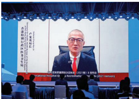
▲香港特別行政區醫務衛生局局長盧寵茂線上致辭。