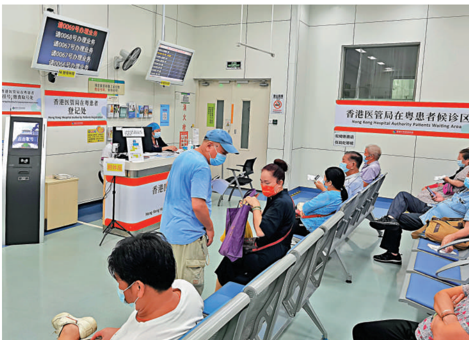
▲9月22日，深圳發布內地首個「國際版」醫院評審標準，方便國際保險客戶「刷醫保」。圖為港大深圳醫院香港醫管局在粵患者候診專區。

同時，隨着粵港澳大灣區的融合發展，港澳和醫療跨境銜接已成為一個緊迫的需求，「國際標準（2021版）」可在包括港澳醫院在內的大灣區醫療機構推廣應用，推進大灣區醫療同質化和跨境醫療服務規則銜接。「港澳醫療機構也可以通過這個標準進一步沿着「一帶一路」沿線國家走向國際，讓我們整個中國的標準得到國際認可。」徐小平說。