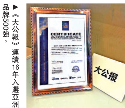
品牌500強。《大公報》連續16年入選亞洲

【大公報訊】記者倪夢環上海報道：2022年《亞洲品牌500強》排行榜22日在滬發布，今年共有214個中國（包括港澳台）品牌入選榜單，中國依舊是上榜品牌數量最多的國家。