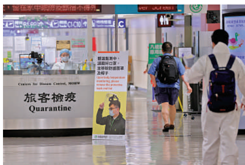
▲台灣方面將逐步放寬入境限制。資料圖片

台灣中華航空說明，因應邊境管制放寬後的市場需求，客運全線增加航班。長榮航空7月起已陸續加密航班並恢復部分航點飛航服務，預計10月整體航班數量將較6月增加近3倍。