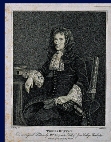
▲英國17世紀的奴隸貿易投資者魯斯塔特的肖像。