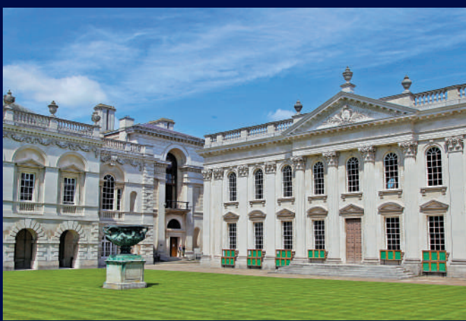
▲英國劍橋大學評議會大樓外景。