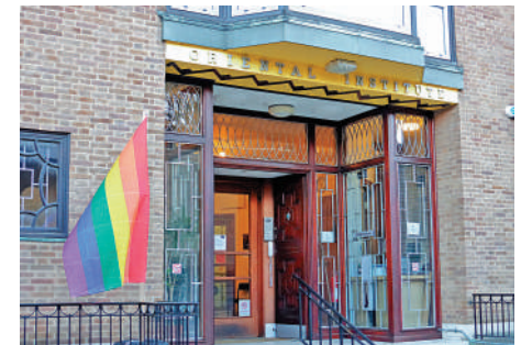
▲英國牛津大學「東方研究學院」改名前的照片。

英國倫敦城市大學的「卡斯商學院」因為與17世紀奴隸貿易商人約翰·卡斯有關，在2020年改名為「貝葉斯商學院」。