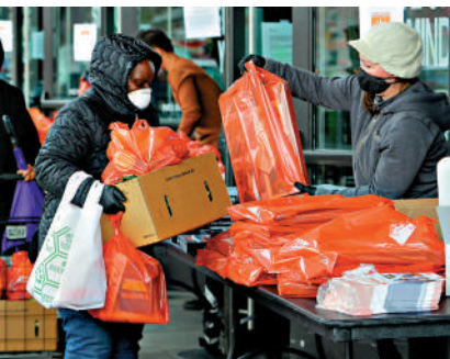
▲疫情期間，美國民眾從食物銀行領取物品。網絡圖片

示，疫情期間已出現1000多起涉及失業救濟金的詐騙案件。聯邦檢察官在9月20日起訴了48人，他們被指控從政府的兒童免費餐援助計劃中詐騙了2.5億美元。