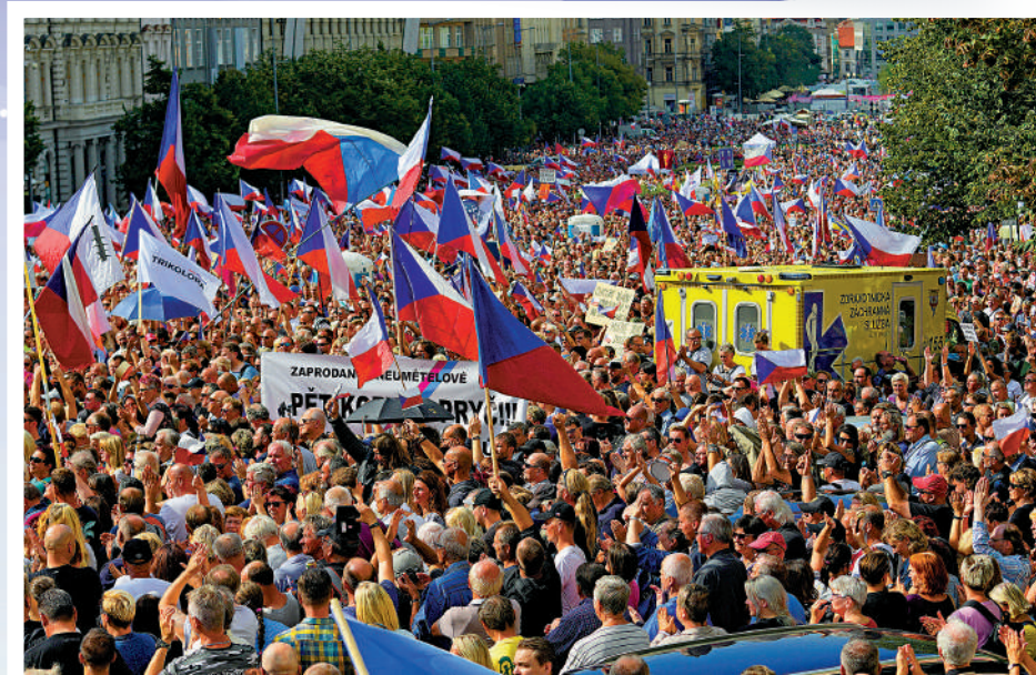
▲能源危機嚴重影響歐洲民生，圖為捷克民眾本月抗議能源漲價。

火爐，準備迎接寒冬。8月中旬，「brennholz」（德語木柴）在谷歌上的搜索量飆升。德國聯邦木柴協會表示，市場上的木柴已經被搶購一空。供貨商轉而從波蘭進口，導致波蘭也出現木柴供應緊張，德波兩國民眾紛紛進入森林撿拾柴火。