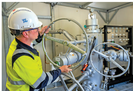
▲德國能源巨頭Uniper面臨破產危機，被收歸國有。資料圖片

德國於今年4月宣布接管俄羅斯天然氣工業股份公司在當地的分公司Gazprom Germania，本月又宣布接管俄羅斯石油公司在德國的業務。俄羅斯石油公司在德煉油廠是柏林的關鍵能源來源之一。俄羅斯方面指責德國違反國際法。