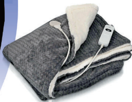
▲歐洲多國爭相購買取暖設備，中國電熱毯出口量大增。網絡圖片