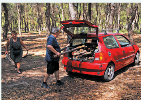
▲比利時民眾12日搬運木柴，用於在冬季