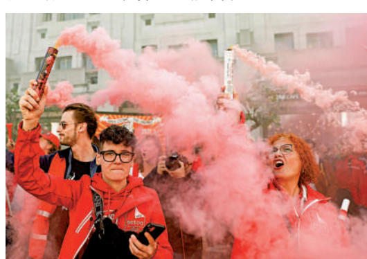
▲歐盟多國近日爆發抗議物價上漲的示威，民粹主義政黨從中漁利。

瑞典、意大利、捷克和斯洛伐克等國的民粹主義政客自稱是民眾的代言人，但歐洲媒體指出，他們的共同點是反對與歐盟深入合作、排外和支持經濟保護主義政策，一旦得勢料將引發政治海嘯，甚至令歐盟分崩離析。