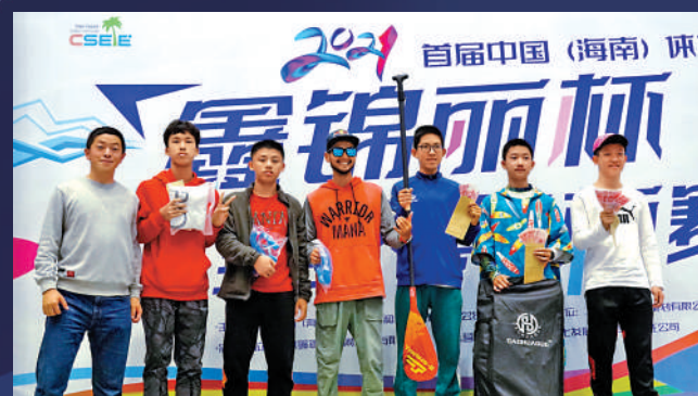
槳板運動近年受到不少年輕人歡迎。