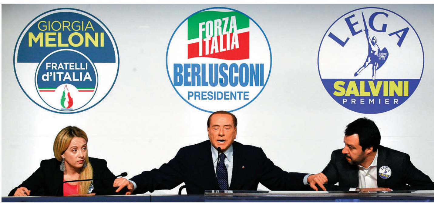
▲意大利兄弟黨黨魁梅洛尼（左）、力量黨黨魁貝盧斯科尼（中）和聯盟黨黨魁薩爾維尼（右）。