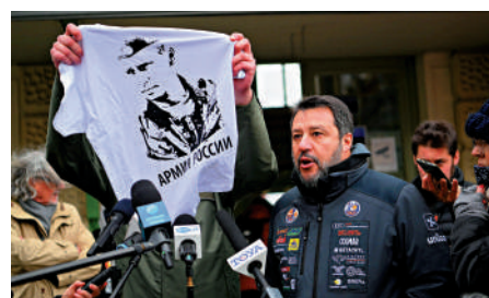
▲俄烏衝突後，意大利聯盟黨魁薩爾維尼在3月初到訪波蘭，展示一件印有俄羅斯總統普京頭像的T恤。

過合作協議。與貝盧斯科尼、薩爾維尼對俄持「相對友好的態度」不同，有望領導右翼聯盟的梅洛尼則支持烏克蘭，支持其對抗俄羅斯。她曾承諾，上任後將延續德拉吉政府為烏提供軍事支持的政策，以及在制裁俄方面的強硬立場。梅洛尼8月還指出，「烏克蘭戰事只是重塑世界秩序的衝突之中的冰山一角。」