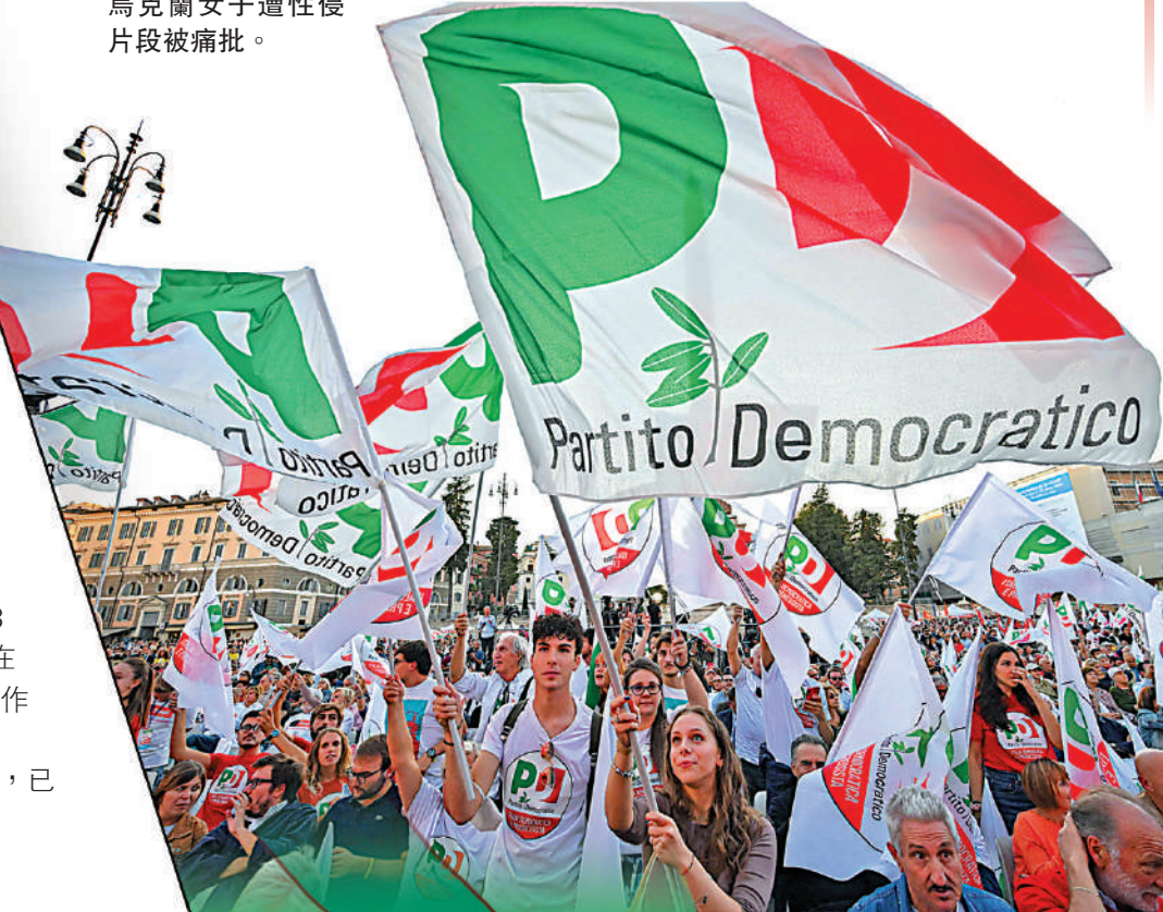
▲意大利中左翼民主黨的年輕支持者23日在羅馬人民廣場舉行集會。

薩爾維尼是聯盟黨的領導人，其極右立場曾被歐盟官員形容為「小墨索里尼」，他在上屆大選時已冒起，高喊「意大利優先」，成為意大利極右勢力的代表人物。可惜聯盟黨的選舉戰績未及同樣打民粹牌的「五星運動」，因此他一直與總理寶座無緣。薩爾維尼一貫口沒遮攔，在任內政部長期間阻止難民船隻登岸引發爭議。大選中，薩爾維尼宣揚「反移民、歐洲懷疑論、去全球化以及意大利人優先」等主張。薩爾維尼立場親俄羅斯。