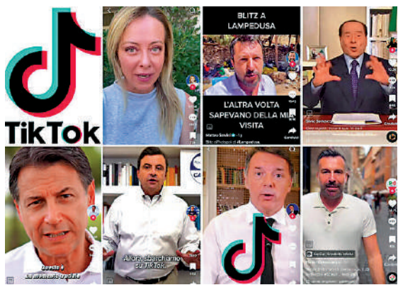
▲意大利政客紛紛進駐TikTok拉票。

這番話在意大利選戰末期增添了一些緊張氣氛。薩爾維尼極度不滿，跑到歐盟羅馬辦事處門前抗議，批評歐盟公開干涉意大利內政，斥馮德萊恩「無理傲慢」，要求她馬上道歉或辭職。