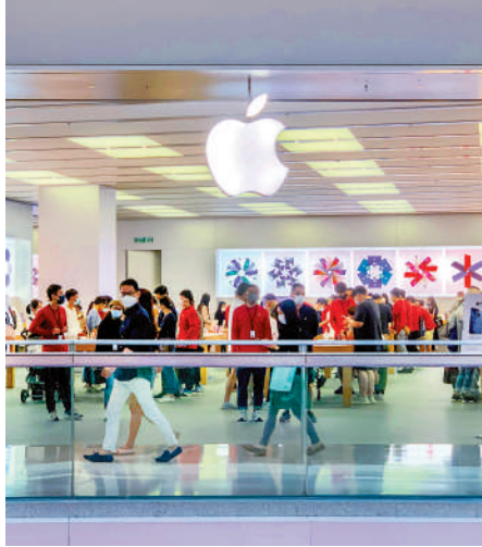
▲蘋果公司發布新手機，有望帶動全球手機出貨量。

備註：[*] 原本20GB另額外獲22GB [^] 原本12GB另額外獲18GB