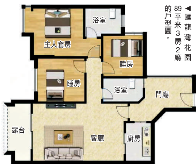
89平米3房2廳的戶型圖。

不過，小區只有707個車位，車位比是0.9：1，車位較緊張。另外，3幢的位置靠馬路，噪音較大。