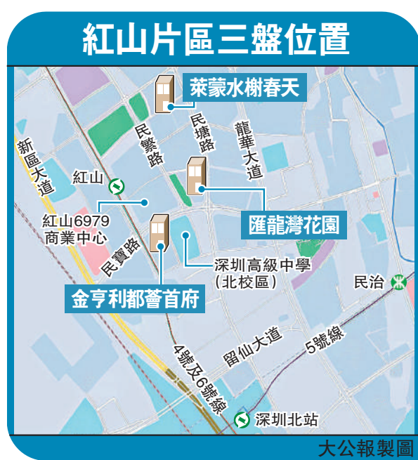
紅山片區三盤位置