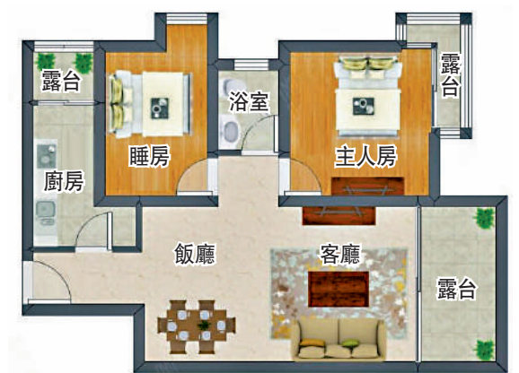
▲萊蒙水榭春天66平米2房2廳的戶型圖。