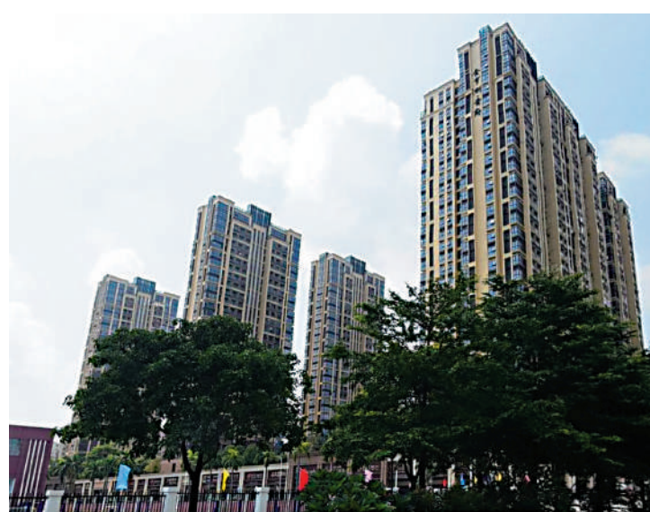
▲紅山片區有不少優質的教育配套，圖中的金亨利都督首府就有深圳高級中學（北校區）在旁。

同時，深圳美術館新館、深圳市第一圖書館、深圳演藝中心、龍華未來城市展覽館合稱的「龍華四館」坐落紅山片區，這幾大場館是深圳市、區級文化配套群中的標誌性建築。其中，演藝中心、展覽館已投入使用，待明年美術館、圖書館建成後，將極大滿足區域內居民的多元藝術人文生活需求。