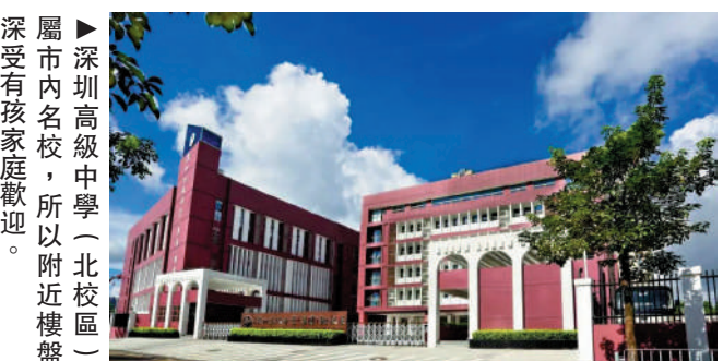
▲深圳高級中學（北校區）屬市內名校，所以附近樓盤深受有孩家庭歡迎。

配套豐富 金亨利都督首府住宅項目位於龍華新城核心區，緊鄰的深圳北站是廣深港客運專線和廈深鐵路的交匯樞紐；配套有九方購物中心、深圳高級中學（北校區）等優質商業及公共設施，因此成為不少既要好學位，又要樓盤新的購房者的熱門選擇。