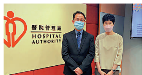
▲有研究團隊在HADCL支援下，開發了一套自動識別髖關節骨折的人工智能AI系統。

功，將擴展至其他急症室使用。他補充，因冬季骨質疏鬆、穿衣過厚導致感知不敏感等原因，老人跌倒的情況或大幅上升，屆時該系統的幫助將更明顯。他希望，未來研究還可拓展至其他身體部位。