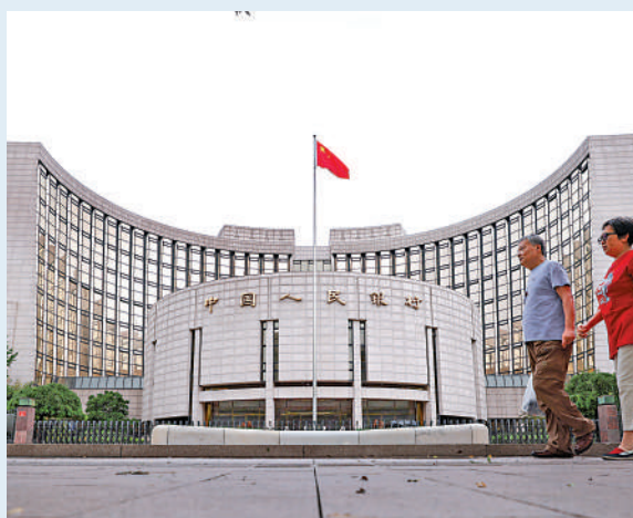
▲人行上調遠期售匯業務外匯風險準備金率，藉引導市場預期，護航匯率穩定。