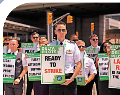
達美航空飛行員6月在紐約肯尼迪國際機場示威。

2020年7月22日，Go To Travel計劃正式實施，日本隨即出現第三波新冠疫情，菅義偉因此受到猛烈抨擊，民望急劇下滑，於2020年12月28日叫停該計劃，其間累計8781萬人參與。