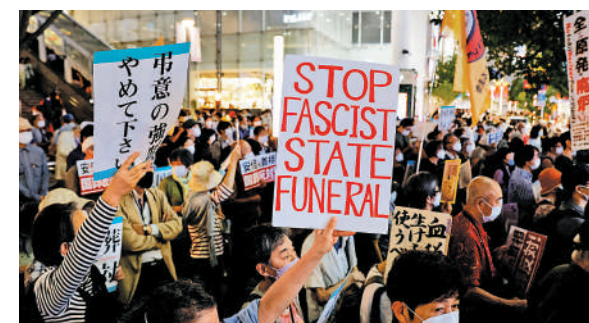
日本前首相安倍晉三今國葬，圖為東京街頭25日爆發的反國葬示威。