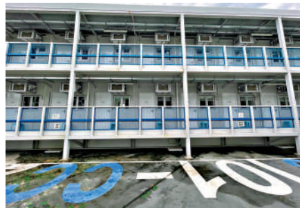
▲專家認為，設有獨立廁所的社區隔離設施，稍作改裝，最快一、兩個月即可成為過渡性房屋單位。