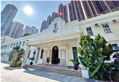
▲保良局一名院舍女職員因涉嫌虐兒，上周二被警方拘捕。

【大公報訊】繼早前香港保護兒童會「童樂居」爆出大規模虐兒案後，保良局近日亦爆出有職員涉嫌虐兒事件。局方已把個案交警方調查，警方上周二已拘捕一名院舍女職員。