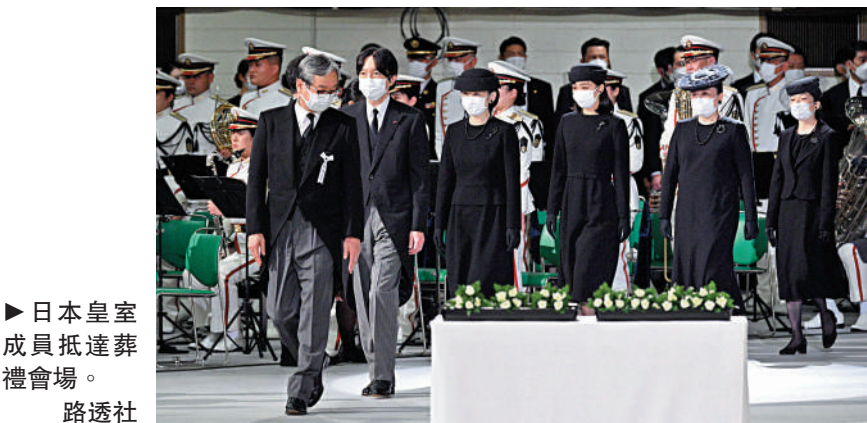
►日本皇室成員抵達葬禮會場。

的原因。另一些示威者批評當局擅自動用超過16.6億日圓（約9090萬港元）的稅金舉行葬禮，卻無視民眾面對的經濟困境。