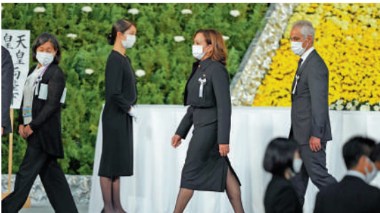
▲美國派出副總統哈里斯（左三）參加安倍葬禮。

共同社9月中旬的民調顯示，逾六成日本民眾反對國葬。藤原伊織說，為了日本的未來，年輕人應當站出來，這也是她參加示威