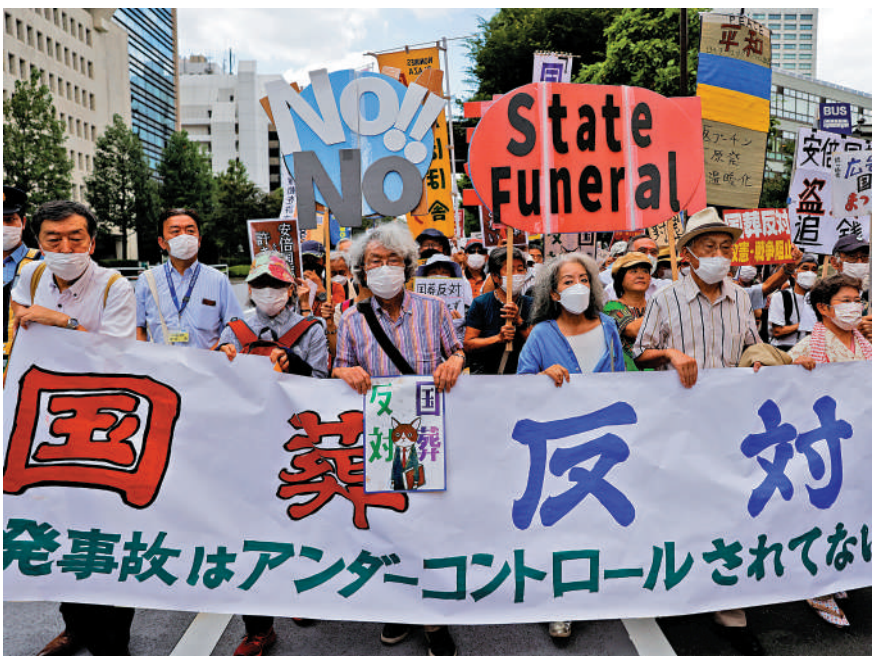
▲日本民眾27日在東京示威，反對為安倍舉行國葬。

當地時間27日下午1時20分（本港時間中午12時20分）左右，遺孀安倍昭惠抱着安倍的骨灰盒乘車從東京澀谷區的家中出發，前往日本武道館。約1400名自衛隊員參與護送骨灰、沿途列隊敬禮等工作，並在安倍昭惠等人步入葬禮會場時鳴響19次禮炮。日本當局部署了約2萬名警察負責國葬安保。