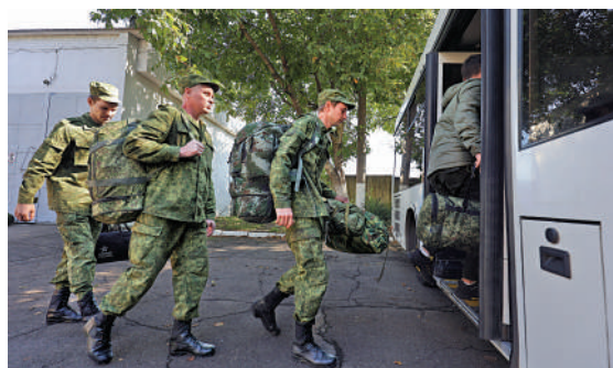
▲俄羅斯新兵25日坐車離開徵兵中心。

2010年，「維基解密」網站曝光大量有關阿富汗和伊拉克戰爭的美國外交電報和美軍機密文件，揭發美軍戰爭罪行。阿桑奇因此被美國控以間諜罪等18項刑事罪名。分析指，斯諾登與阿桑奇的遭遇如同一面鏡子，照出美英聲稱的維護新聞自由是何等虛偽，揭露別國享有充分的自由，揭露本國和盟友就要嚴懲不貸。