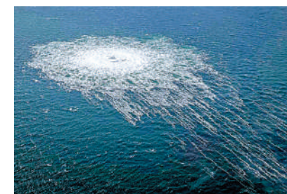
▲「北溪」管道三處地點發生洩漏，事故發生處海面出現異常。

克里姆林宮發言人佩斯科夫27日被問及洩漏事故是否是人為破壞導致，他回答說，「目前不能排除