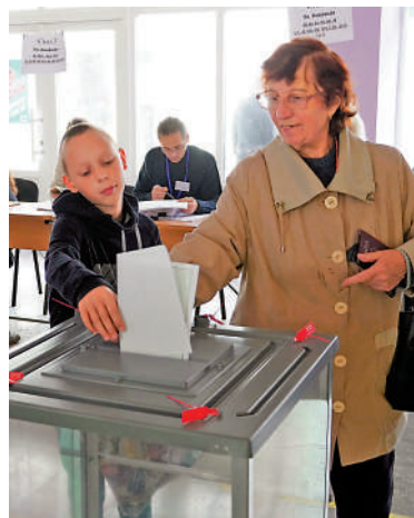
▲馬里烏波爾民眾27日參與入俄公投。

【大公報訊】綜合美聯社、《衛報》報導：烏克蘭盧甘斯克、頓涅茨克、扎波羅熱、赫爾松四地區的「入俄公投」於當地時間23日至27日舉行。俄羅斯媒體27日報導，公投初步結果顯示，選擇支持加入俄羅斯的民眾已經超過97%。烏克蘭方面周二表示，公投結果不會對戰場上的軍事目標有任何影響。